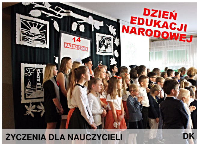
ŻYCZENIA DLA NAUCZYCIELI