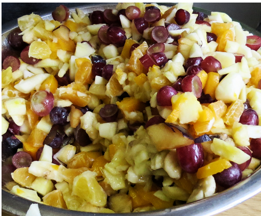
Sałatka przygotowana przez kl.I K.K