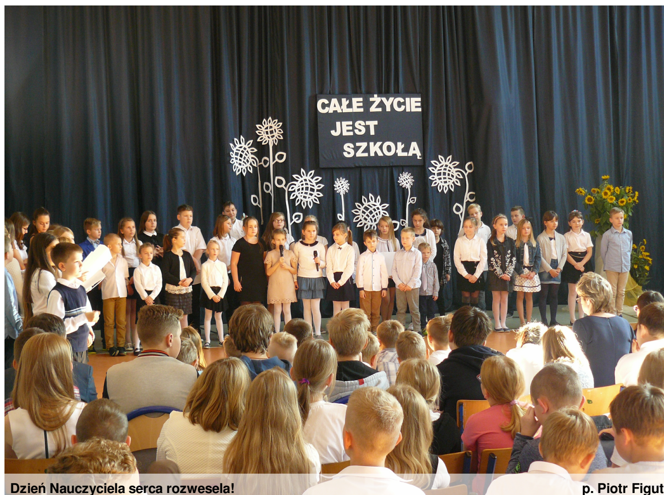
Dzień Nauczyciela serca rozwesela!