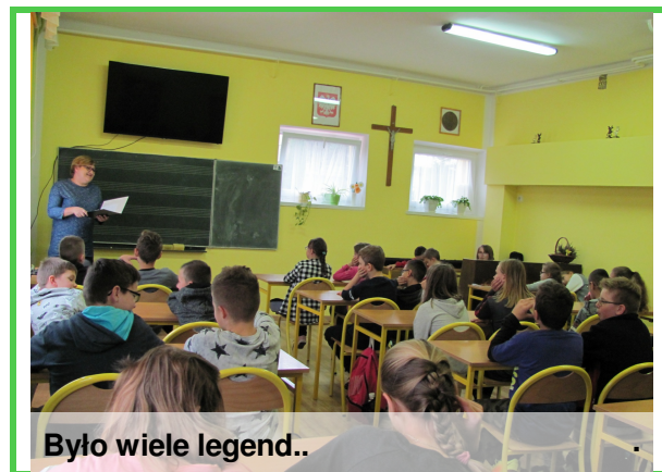
Było wiele legend..