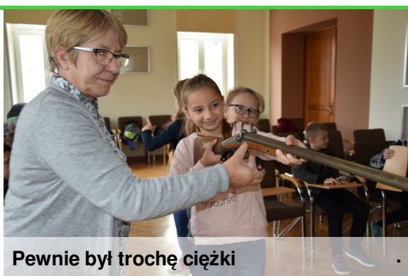
Pewnie był trochę ciężki