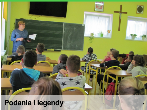
Podania i legendy