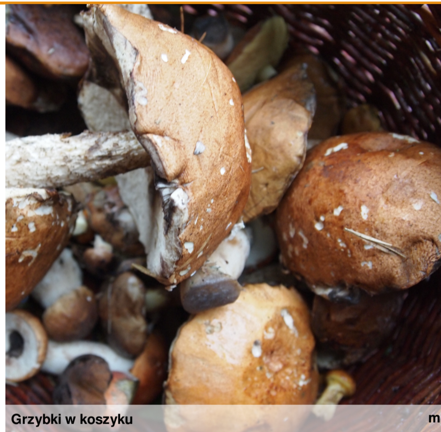
Grzybki w koszyku