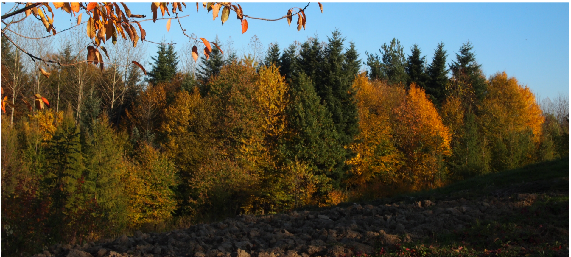
Piękna, złota, polska Jesień :)