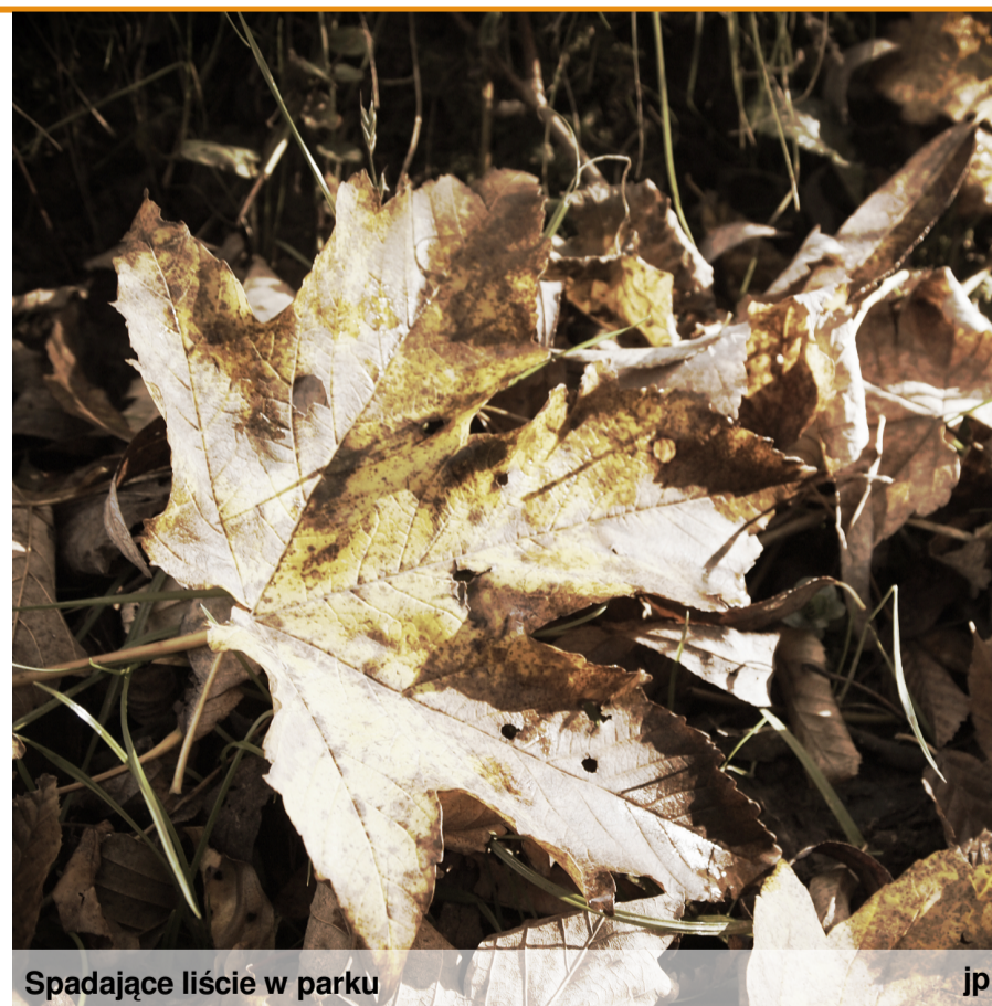
Spadające liście w parku