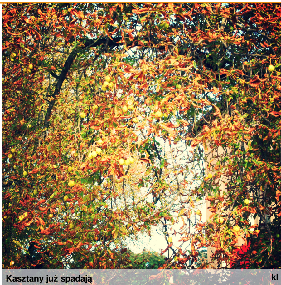
Kasztany już spadają