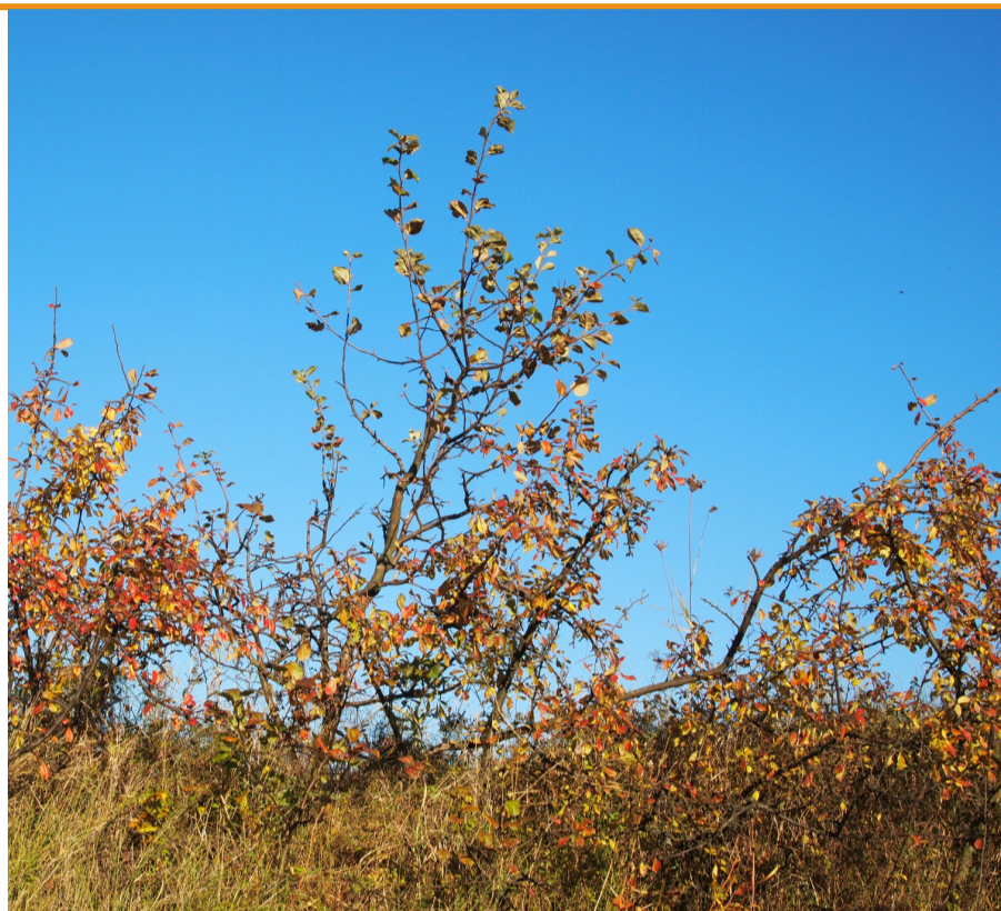
Jesienne głogi i róże