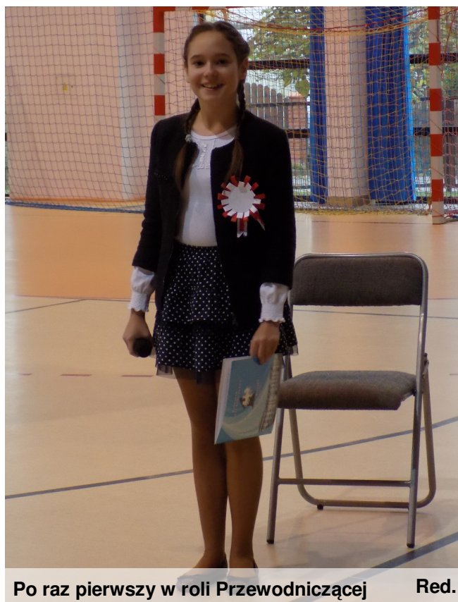
Po raz pierwszy w roli Przewodniczącej