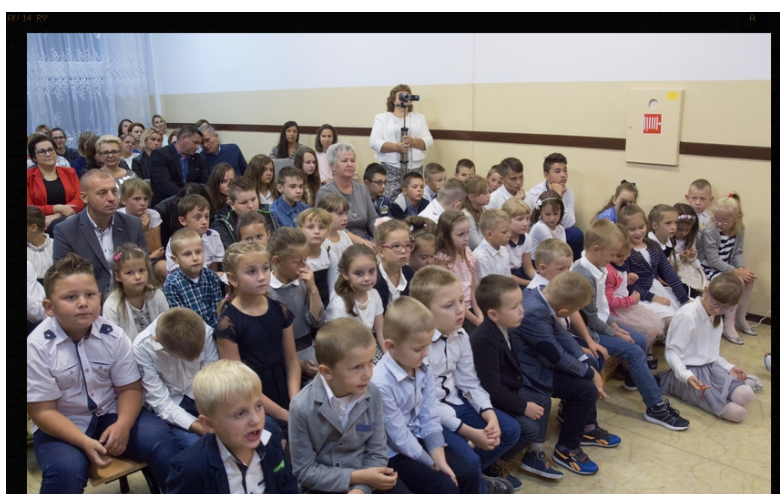
Zabieramy się do nauki!