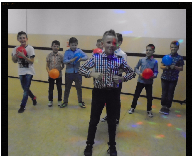
Królowie szkoły!!! Red.