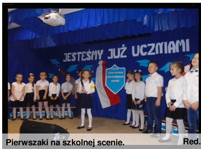
Pierwszaki na szkolnej scenie. Red.