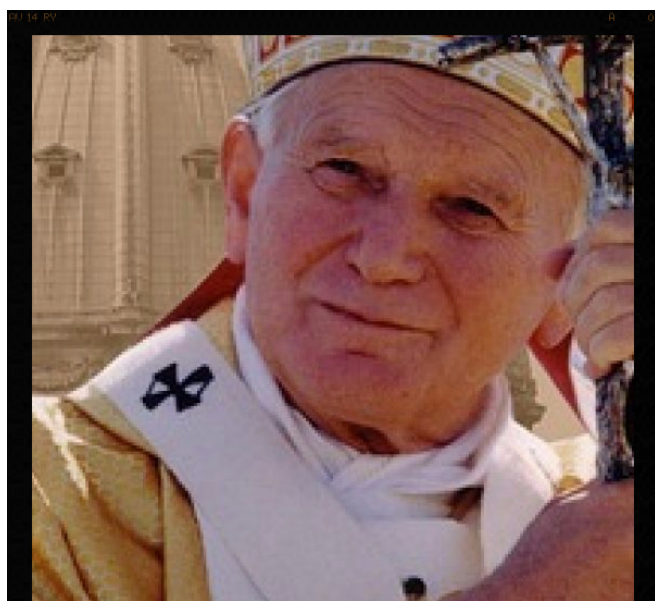
Na zawsze w naszej pamięci. Red.