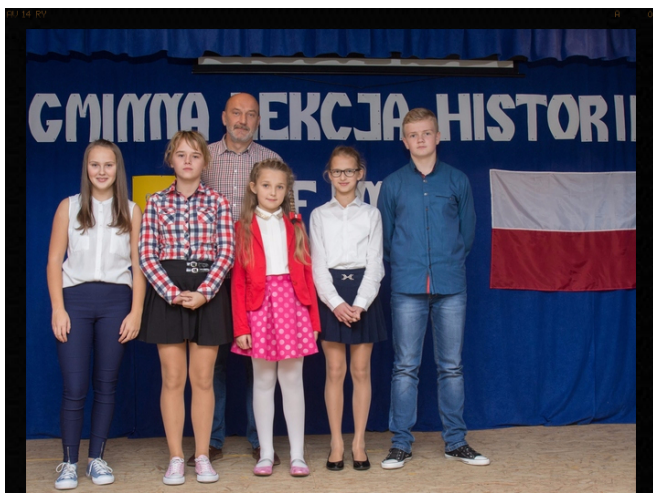
Nasza "historyczna" drużyna. Red.