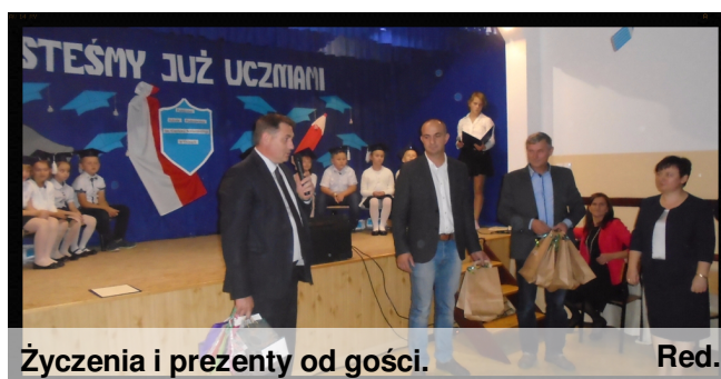
Życzenia i prezenty od gości. Red.