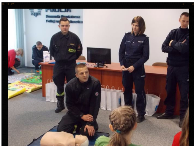
Udzielanie pierwszej pomocy.