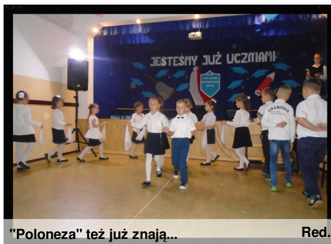
"Poloneza" też już znają... Red.