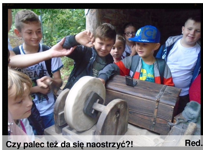
Czy palec też da się naostrzyć?!