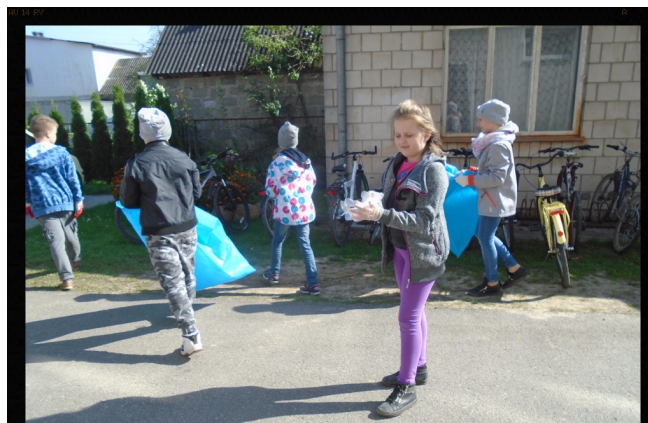
Pogromcy śmieci i królowie recyklingu. Red.

POSPRZĄTALI ŚWIAT! Jak każdego roku włączyliśmy się w tę piękną akcję. Tym razem ze śmieciami walczyła klasa czwarta. Niech za młodu uczą się porządku! Tak trzymać!