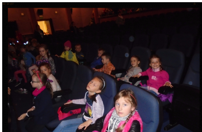
W oczekiwaniu na artystyczne przeżycia. Red.

10 października dzieci z zerówki i klas młodszych wyjechały do Skarżyska-Kamiennej, gdzie w miejscowym domu kultury obejrzały spektakl teatralny „Alicja w Zaczarowanej Krainie” z udziałem aktorów scen krakowskich. Ta forma udziału w kulturze jest lubiana przez naszych uczniów, a pełne fantazji przedstawienie bardzo się wszystkim podobało.