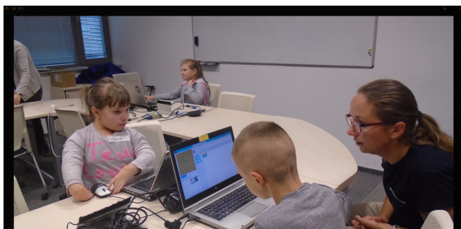
W świecie nowoczesnych technologii.