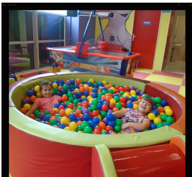
No to nura w kuleczki! Red.

Z okazji „chłopskiego” święta przedstawicielki płci pięknej przygotowały dla swych kolegów liczne niespodzianki. Był wieczorek z tańcem i śmiesznymi konkursami oraz sympatyczne upominki. Zerówka i klasy młodsze doskonale bawiły się w starachowickiej „Bajkolandii”.