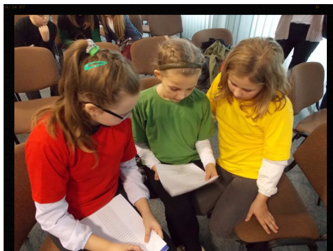
Nasza dzielna drużyna.