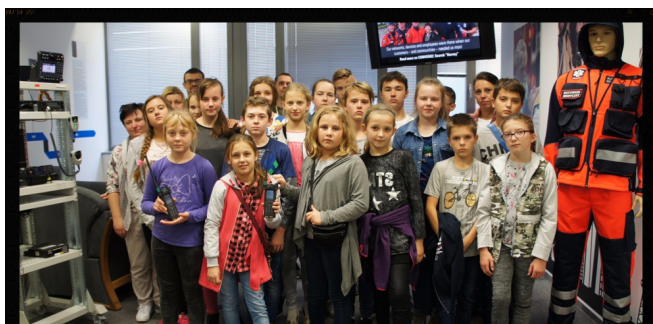
W siedzibie "Motoroli".

17 października odbyła się wycieczka do Krakowa. Pierwszym punktem programu była wizyta w siedzibie firmy „MOTOROLA”, największego w kraju producenta sprzętu telekomunikacyjnego dla wojska i służb bezpieczeństwa. Dzieci uczestniczyły tam w warsztatach programowania, które wzbudziły ich duże zainteresowanie. Następnie przyszła pora na poznawanie zabytków dawnej stolicy. Młodzi turyści podziwiali Wawel i Barbakan, wędrowali pełnymi uroku uliczkami Starego Miasta i obejrzel zieżącego ogniem Smoka. Do Osin wrócili zmęczeni, ale pełni wrażeń.