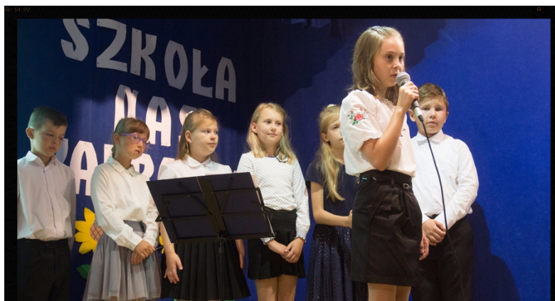
Żegnajcie wakacje, witaj szkoło!