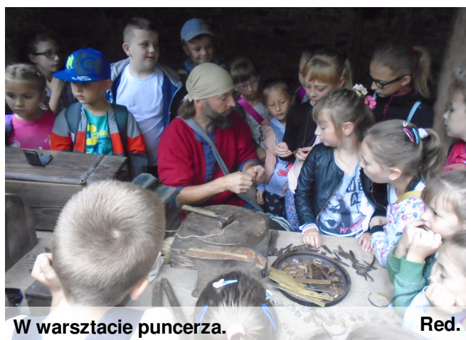
W warsztacie puncerza.