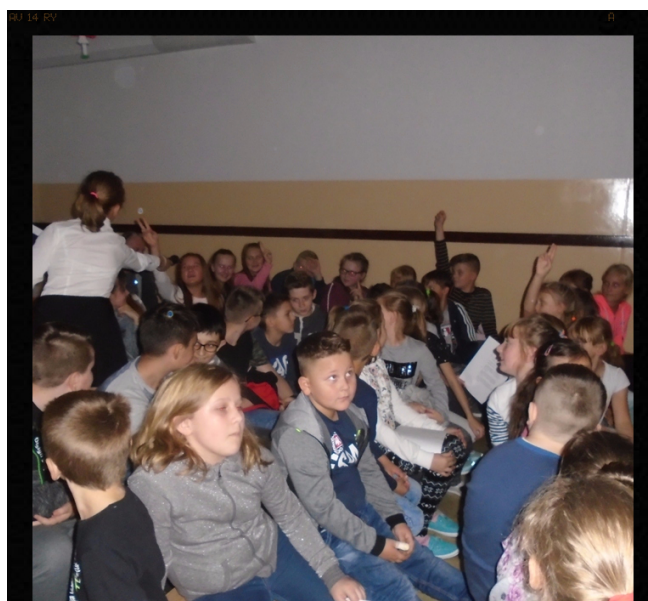
I znowu las rąk. Red.