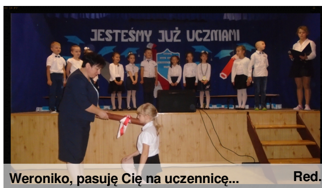
Weroniko, pasuję Cię na uczennicę... Red.