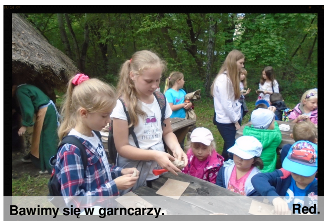
Bawimy się w garncarzy.

11 września nasi uczniowie gościli w Muzeum Przyrody i Techniki w Starachowicach na festynie historycznym „Od Prasłowian do Polaków”. W trakcie trwania imprezy zostały zaprezentowane różnorodne stanowiska warsztatowe. Miłośnicy historii zostali zaproszeni do czynnego udziału w poznawaniu życia codziennego w przeszłości. Dzieci mogły spróbować swoich sił jako garncarz, tkaczka, puncerz, kaligraf czy kowal, przyrzeć się pracy kamieniarza a także własnoręcznie wykonać papier czerpany. Dużym zainteresowaniem cieszyło się stanowisko ze starożytnym piecem dymarskim. Dodatkową atrakcją był plenerowy spektakl średniowieczno-jarmarczny pt. „Za siedmioma wiekami” przygotowany przez Teatr Rozrywki Trójkąt z Zielonej Góry.