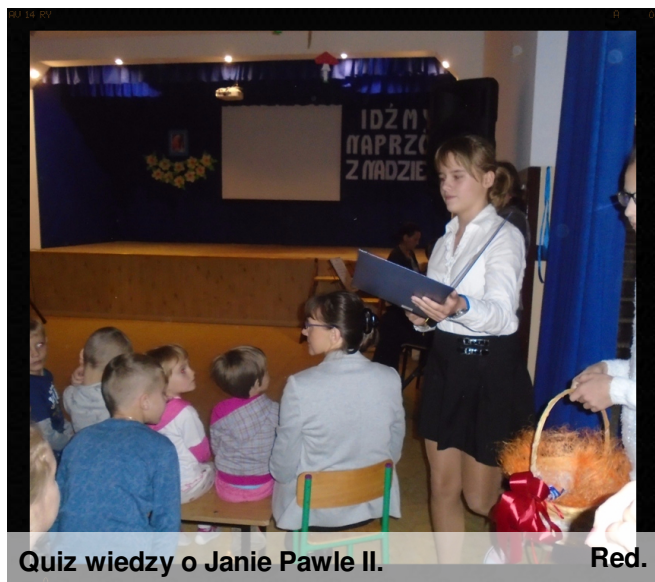
Quiz wiedzy o Janie Pawle II. Red.