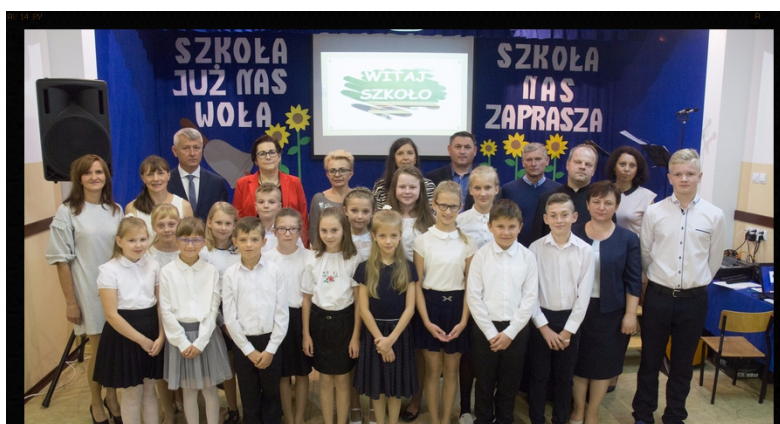
Młodzi aktorzy oraz goście.