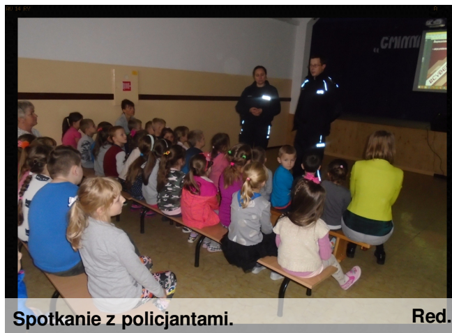
Spotkanie z policjantami.

26 października gościliśmy w szkole przedstawicieli policji. Dzieci z klas młodszych wysłuchały pogadanki o bezpieczeństwie w ruchu drogowym oraz podstawowych zasadach bezpiecznego postępowania w różnych sytuacjach życiowych. Klasy IV-VII obejrzały prezentację „Bezpieczeństwo w Internecie”.