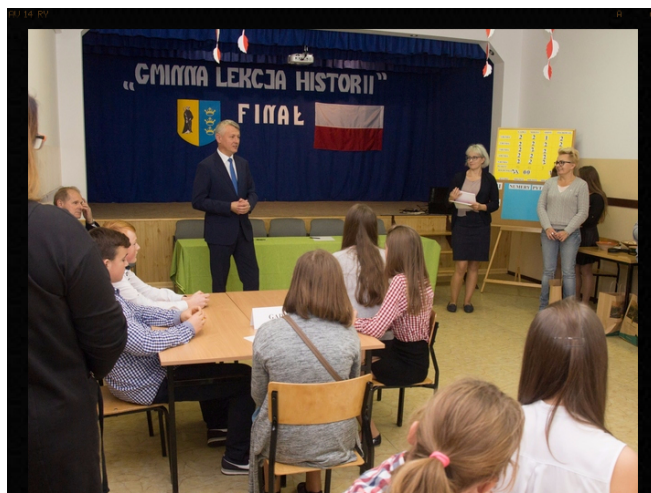
Finał konkursu o historii gminy. Red.