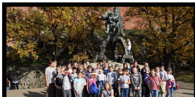
Spotkanie ze Smokiem Wawelskim.