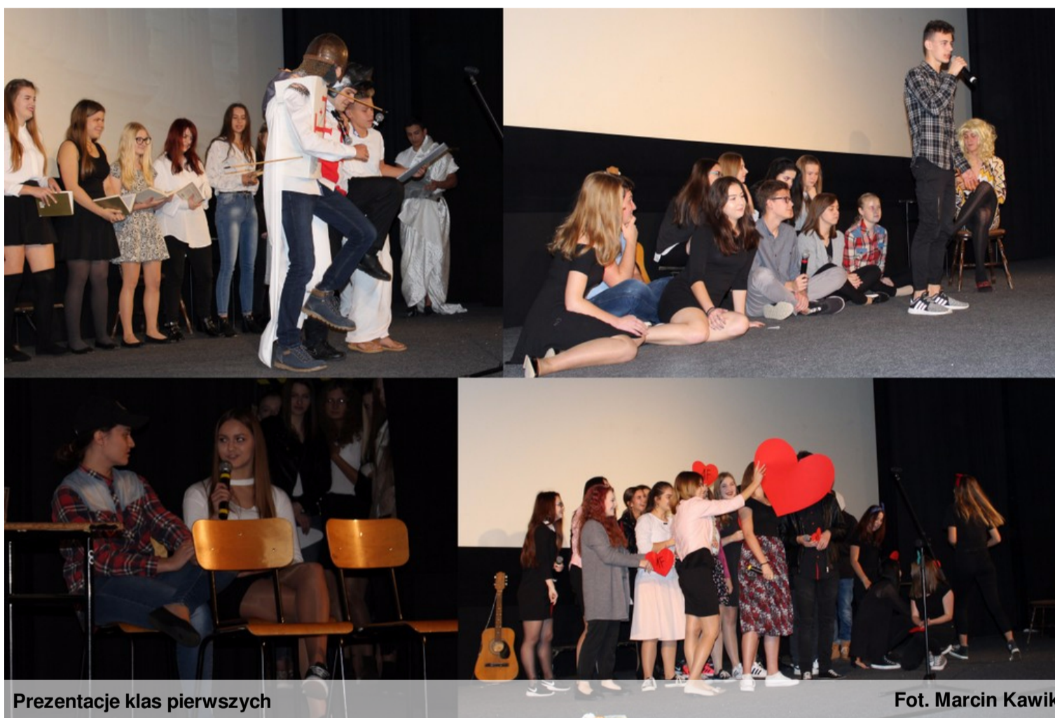
Prezentacje klas pierwszych