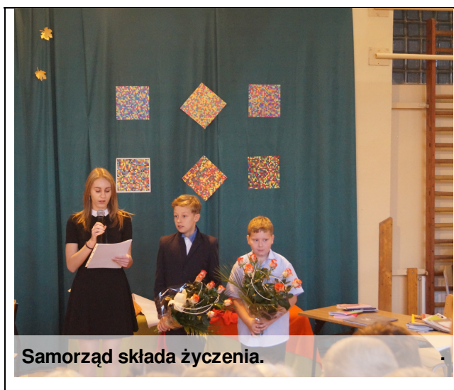
Samorząd składa życzenia.