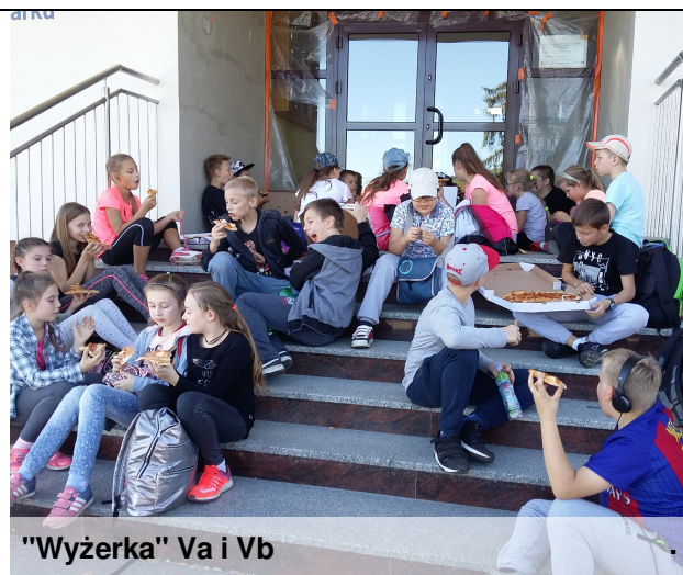
"Wyżerka" Va i Vb