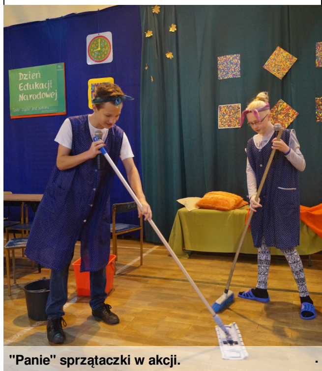
"Panie" sprzątaczkki w akcji.