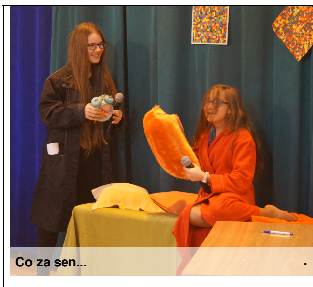
Co za sen...