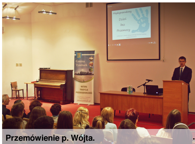
Przemówienie p. Wójta.

2. „Nikt nie powinien się wtrącać w prywatne sprawy rodzinne”. – Jest to wielkim kłamstwem, niestety tak często powtarzanym małym dzieciom, aby nie były wścibskie.