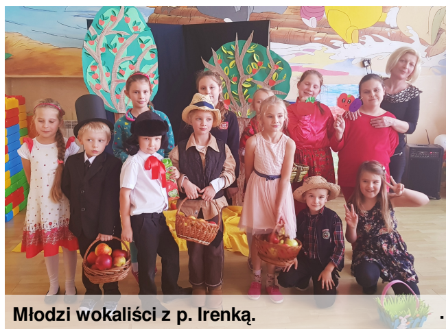
Młodzi wokaliści z p. Irenką.

Wszyscy uczestnicy otrzymali drobne upominki. I. Wolska