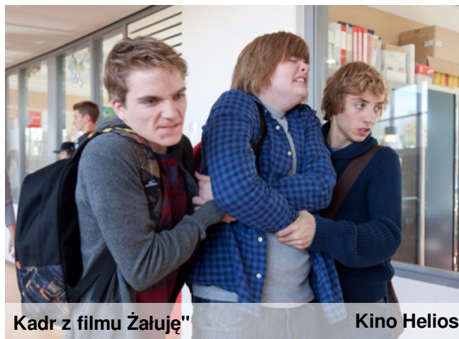
Kadr z filmu „Żałuję”

Bohater znajduje pocieszenie w muzyce i spędzaniu czasu ze swoim czworonożnym przyjacielem, psem