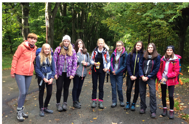
Dzielne dziewczyny z PG2

Droga była dość trudna. Po 15 minutach marszu wszyscy oczekiwali już przerwy. Tego dnia pogoda szczególnie nam nie dopisywała. Z nieba siał deszcz, więc kamienie były bardzo śliskie. Z tego względu na początek wspólnie wybraliśmy trudniejszą trasę na Śnieżne Kotły, by później wrócić łagodniejszą.