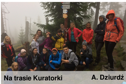
Na trasie Kuratorki

O wrażeniach dziewcząt z trasy przeczytacie na stronie 3 w artykule "Z pamiętnika piechura".