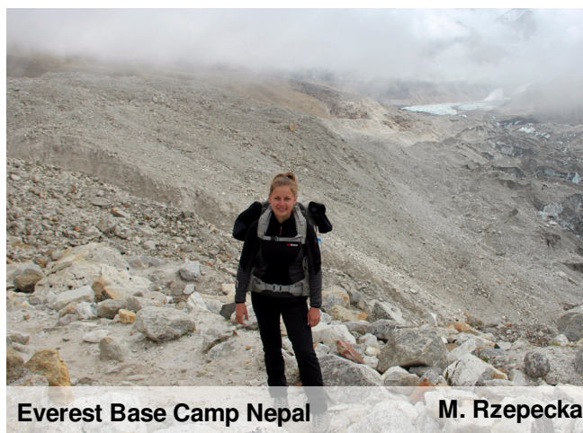
Everest Base Camp Nepal