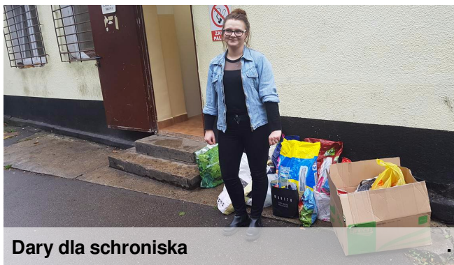
Dary dla schroniska