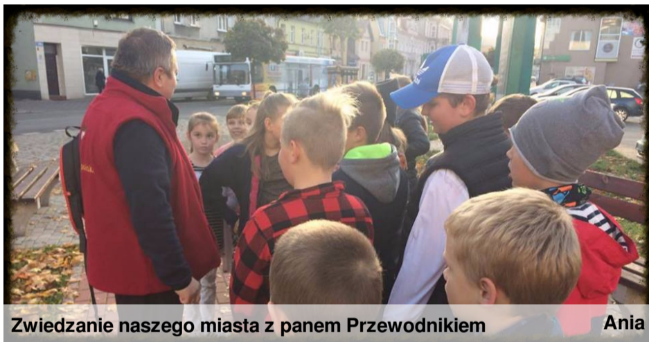
Zwiedzanie naszego miasta z panem Przewodnikiem

Powstało w XIX wieku jako Gimnazjum męskie. Mijając dawne gimnazjum żeńskie udaliśmy się na najstarszą czynną nekropole w Polsce. Tam Przewodnik pokazał nam symbole na pomnikach, które można było zeskanować i przeczytać w Internecie dużo więcej informacji. Pod ścianą tego cmentarza byli chowani ludzie, którzy