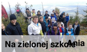
Na zielonej szkole