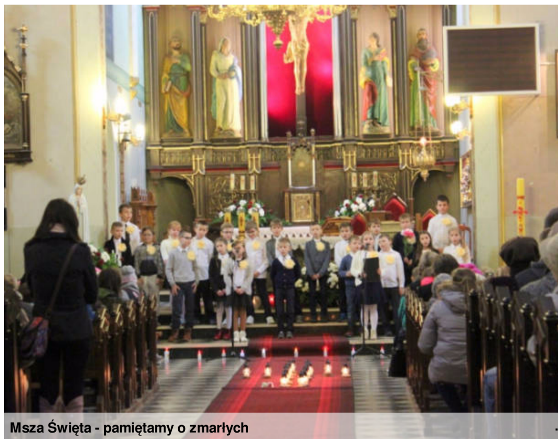
Msza Święta - pamiętamy o zmarłych