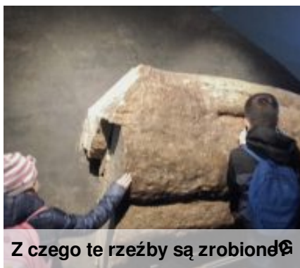
Z czego te rzeźby są zrobione?

Dnia 22 września 2017 r. braliśmy udział w pieszej Wędrówce Integracyjne do Centrum Rzeźby Polskiej