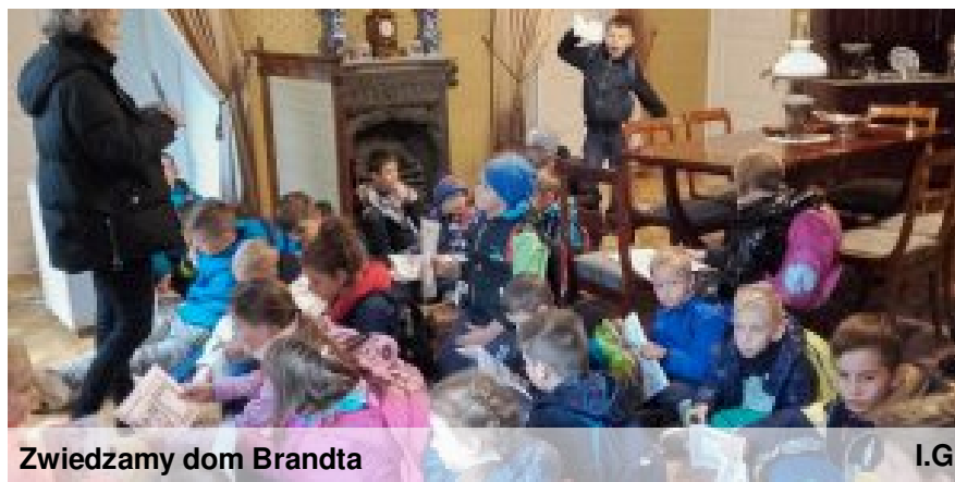
Zwiedzamy dom Brandta