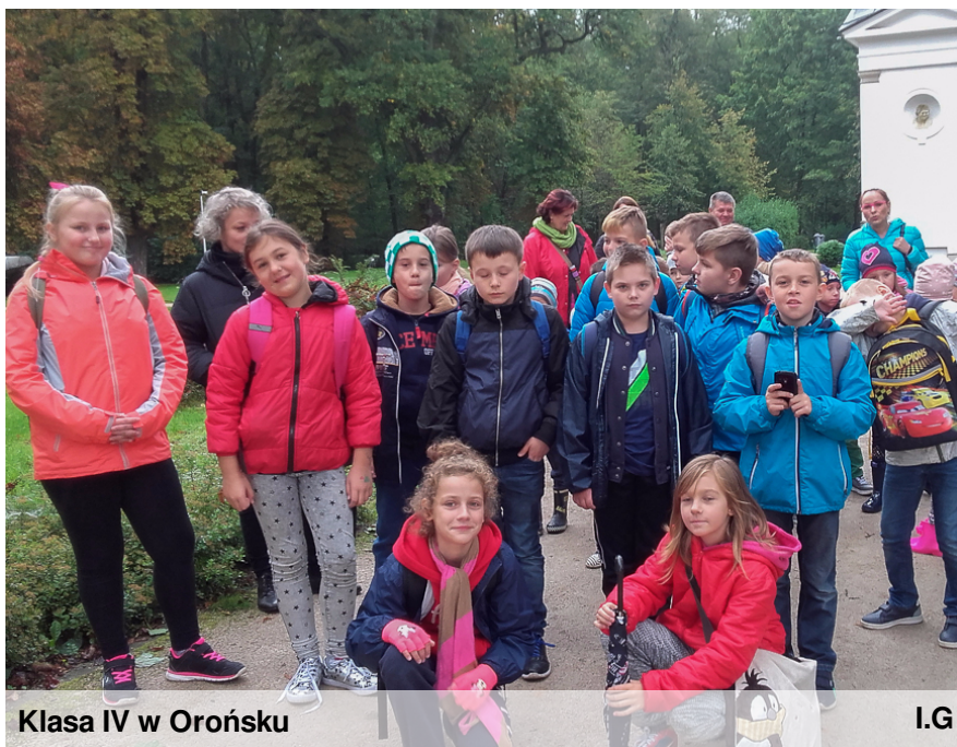
Klasa IV w Orońsku

wybraliśmy się na Wędrówkę Integracyjną do Orońska, gdzie znajduje się Centrum Rzeźby Polskiej. Pani przewodniczka oprowadziła nas po pałacu Józefa Brandta.