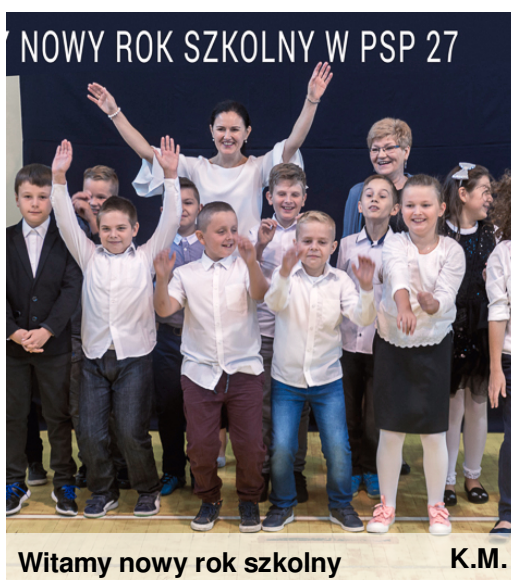
Witamy nowy rok szkolny

1 września powitaliśmy w naszych progach młodszych kolegów. W związku z reformą edukacji szkoła już nie nosi miana gimnazjum. Teraz jesteśmy Publiczną Szkołą Podstawową nr 27 w Radomiu. Oprócz dotychczasowych klas gimnazjalnych, pojawili się nowi uczniowie. Są to klasy Ia i IVa oraz oddziały przedszkolne. Wnoszą oni dużo energii i uśmiechu w mury szkoły.