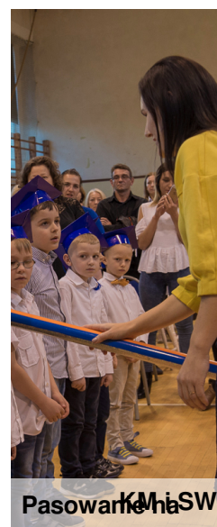
Pasowanie K.M. i S.W.

17 października 2017 r. odbyło się bardzo ważne dla naszej szkoły ślubowanie pierwszoklasistów. To historyczne wydarzenie, ponieważ po raz pierwszy odbywa się ono w nowo powstałej Szkole Podstawowej nr 27. Uczniowie klasy pierwszej, czwartej oraz klas gimnazjalnych