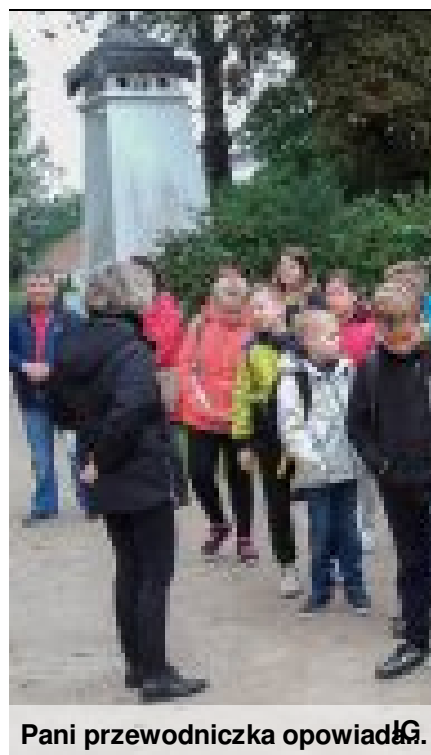
Pani przewodniczka opowiada I.G.