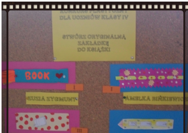
Zwycięskie prace klasy IV A.S.