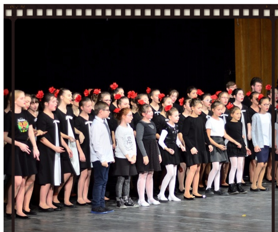
Występy chóru szkolnego