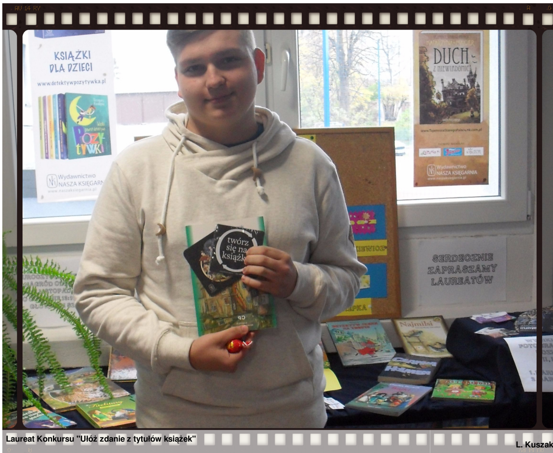
Laureat Konkursu "Ułóż zdanie z tytułów książek"