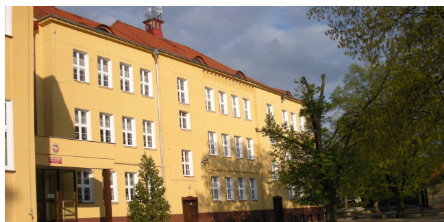
SZKOŁA PODSTAWOWA W SIERAKOWIE

1) Jak się Pan czuje na nowym stanowisku pracy?