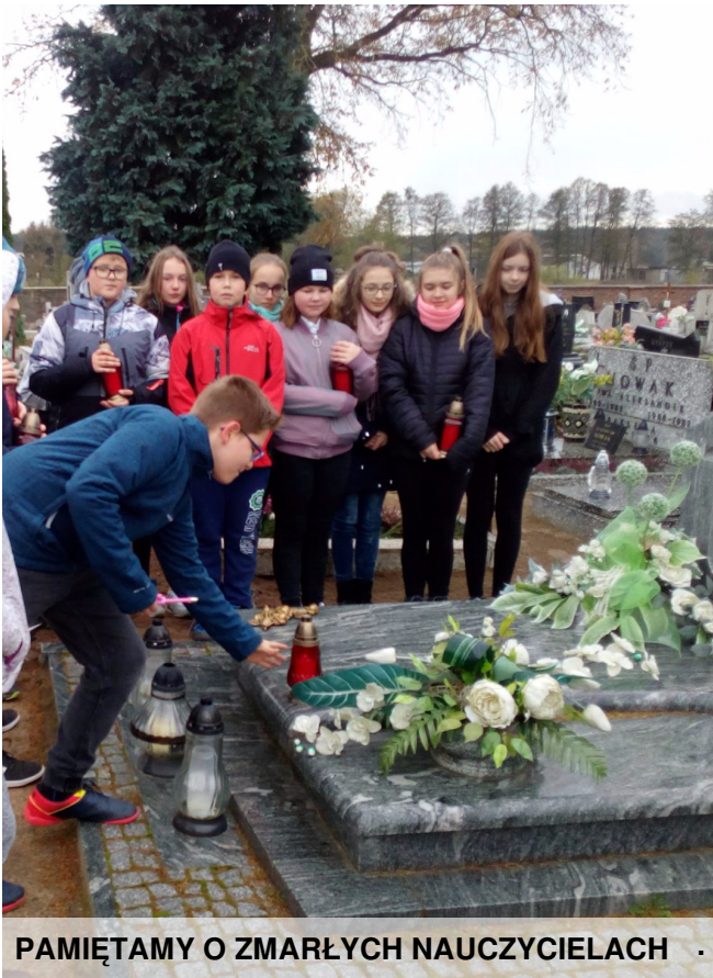
PAMIĘTAMY O ZMARŁYCH NAUCZYCIELACH