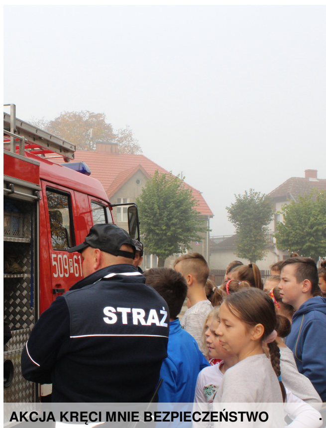
AKCJA KRĘCI MNIE BEZPIECZEŃSTWO