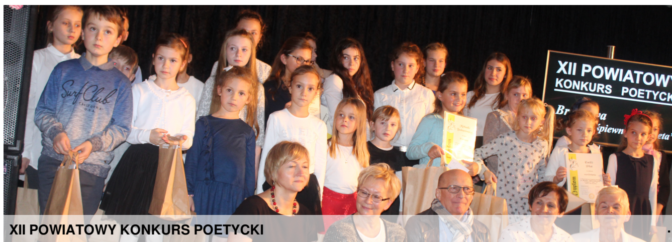
XII POWIATOWY KONKURS POETYCKI