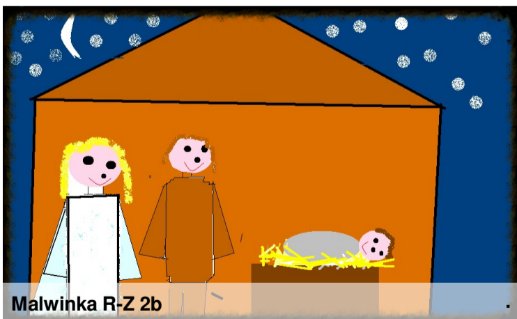
Malwinka R-Z 2b