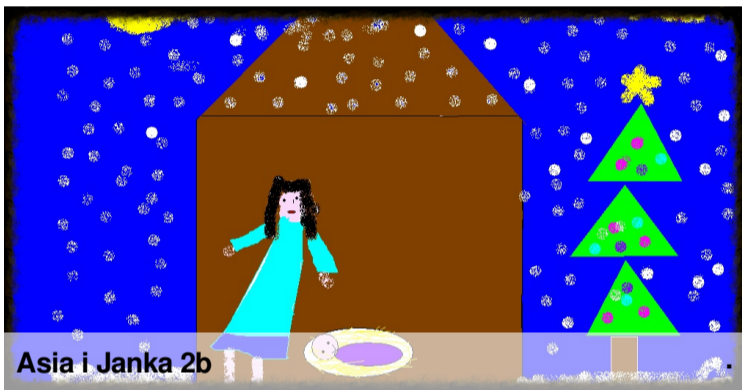
Asia i Janka 2b