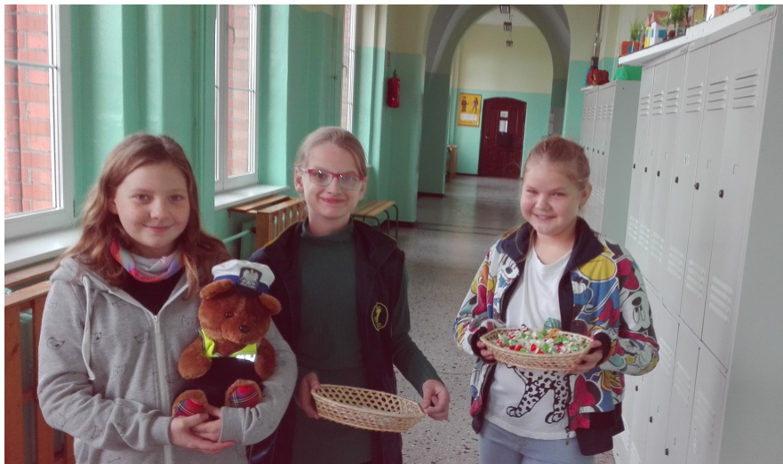
Nasza Straż Czytelnicza