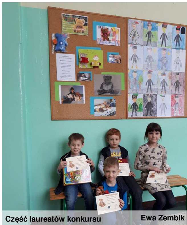
Część laureatów konkursu