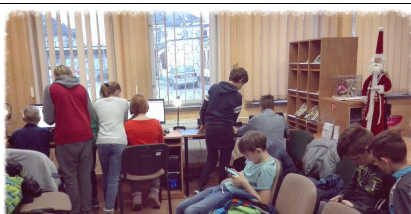
Wyszukiwanie w OPAC

napisały Emilia Musioł i Alicja Jaruk - prace dziewczyn będzie można przeczytać na kolejnym numerze naszej gazetki.