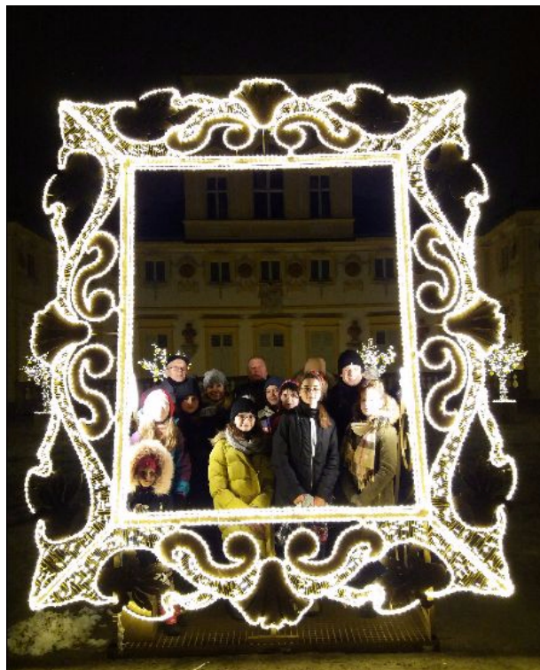
Nocą w Wilanowie