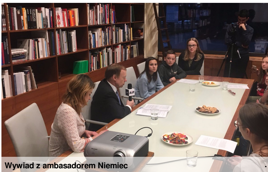
Wywiad z ambasadorem Niemiec