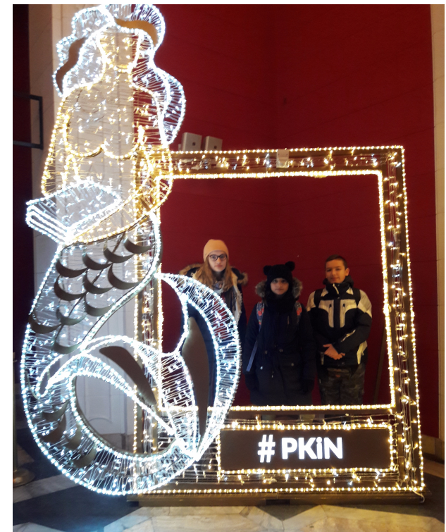
w Pałacu Kultury i Nauki