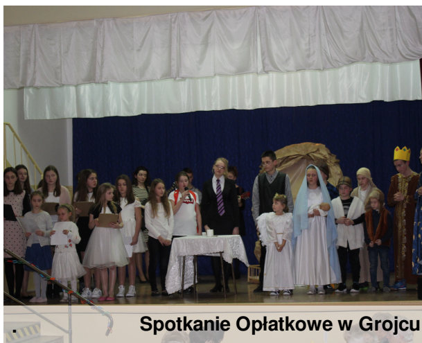
Spotkanie Opłatkowe w Grojcu

Dnia 11 stycznia 2018 roku w Domu Ludowym w Grojcu odbyło się Spotkanie Opłatkowe dla starszych samotnych, małżeństw oraz dziadków i babć dzieci ze scholi i młodzieży z grupy apostołskiej. Na początku ksiądz proboszcz powitał zebranych i zaprosił na występ zespołu Pieśni i Tańca Krakowiaczek. Następnie, po odmówieniu modlitwy, zebrani podzielili się opłatkiem. Nie zabrakło poczęstunku: żurku z kielbasą oraz ciasta,