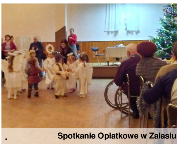
Spotkanie Opłatkowe w Zalasiu