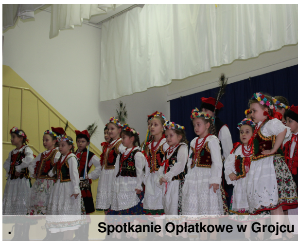
Spotkanie Opłatkowe w Grojcu