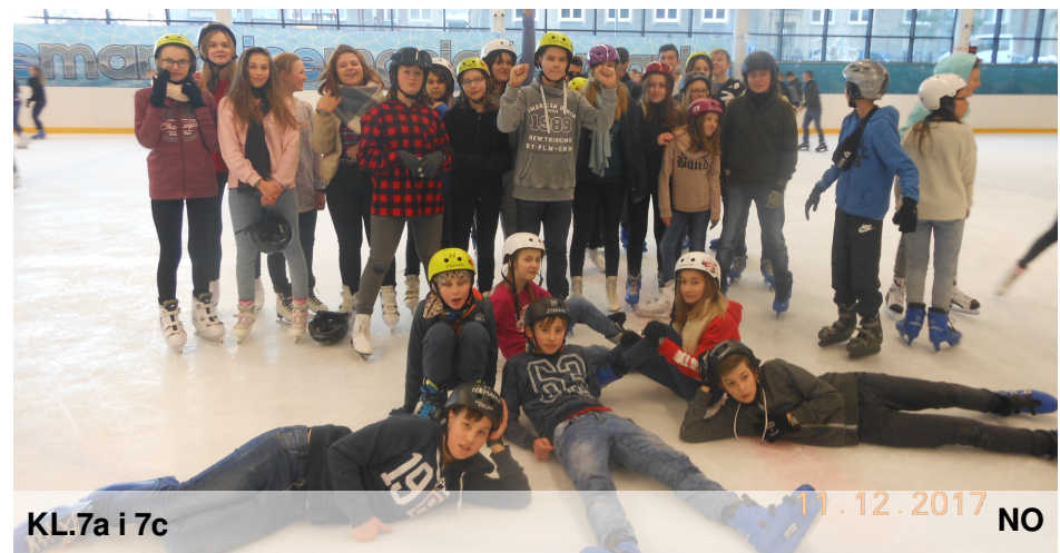
KL.7a i 7c