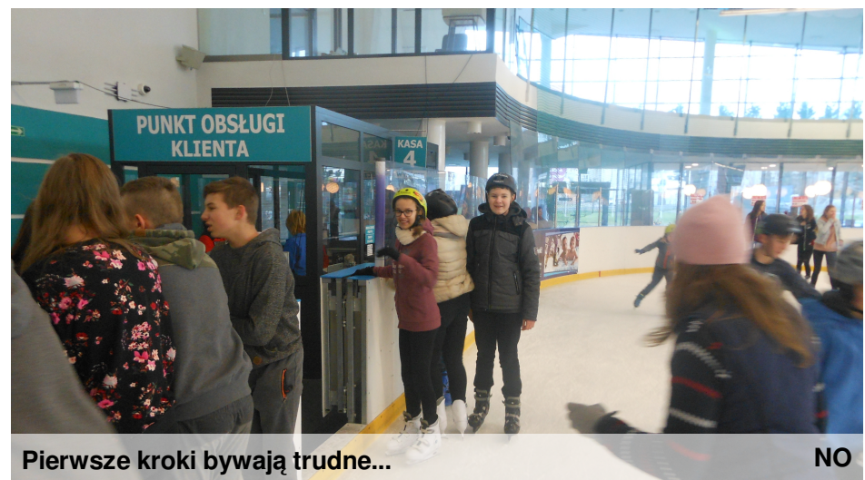
Pierwsze kroki bywają trudne...

Cała lekcja wywarła na uczniach wielkie wrażenie. Mam nadzieję, że takie coś będzie organizowane częściej.