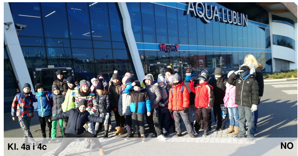
Kl. 4a i 4c