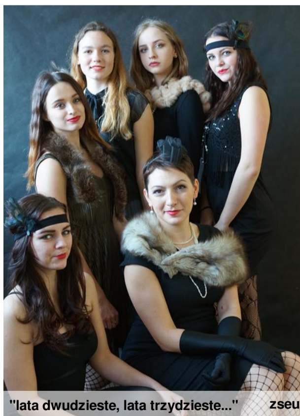
"lata dwudzieste, lata trzydzieste..."