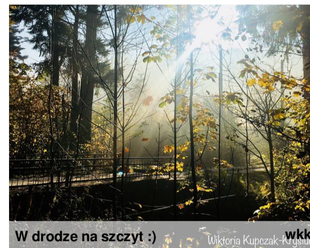
W drodze na szczyt :)