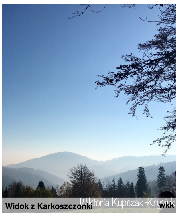
Widok z Karkoszczonki