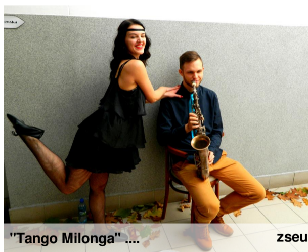
"Tango Milonga" ....