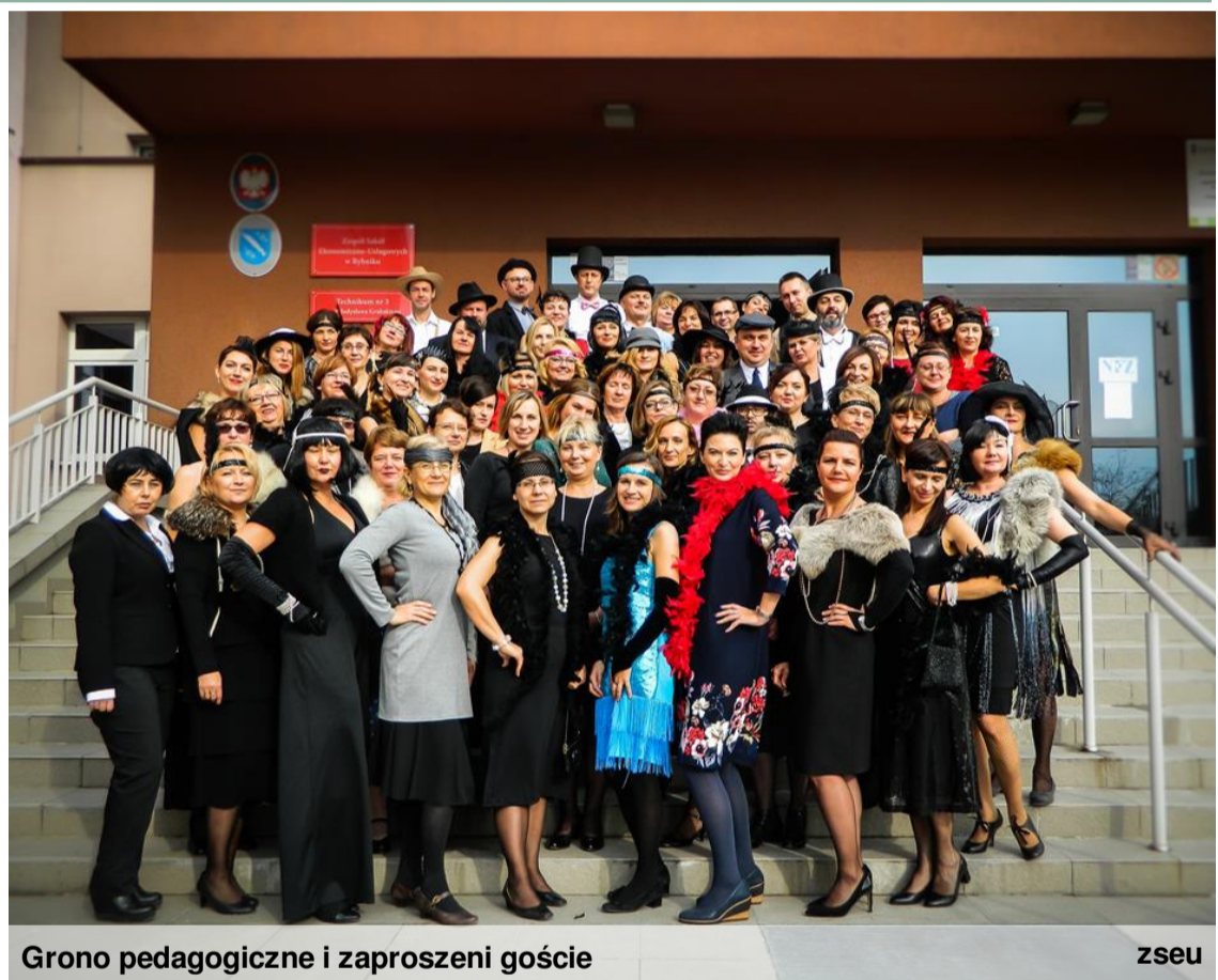
Grono pedagogiczne i zaproszeni goście