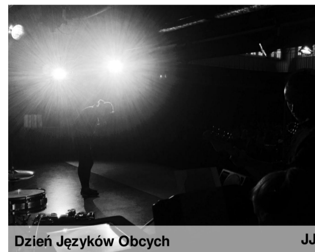
Dzień Języków Obcych