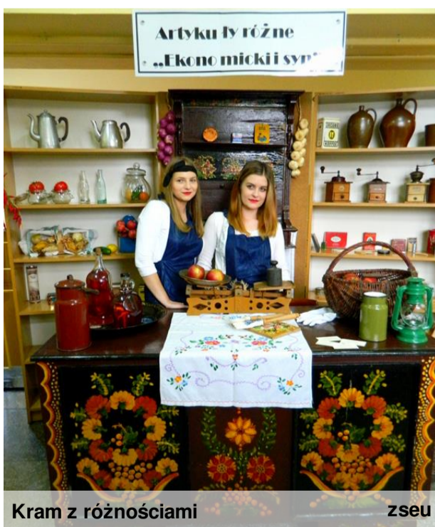
Kram z różnościami