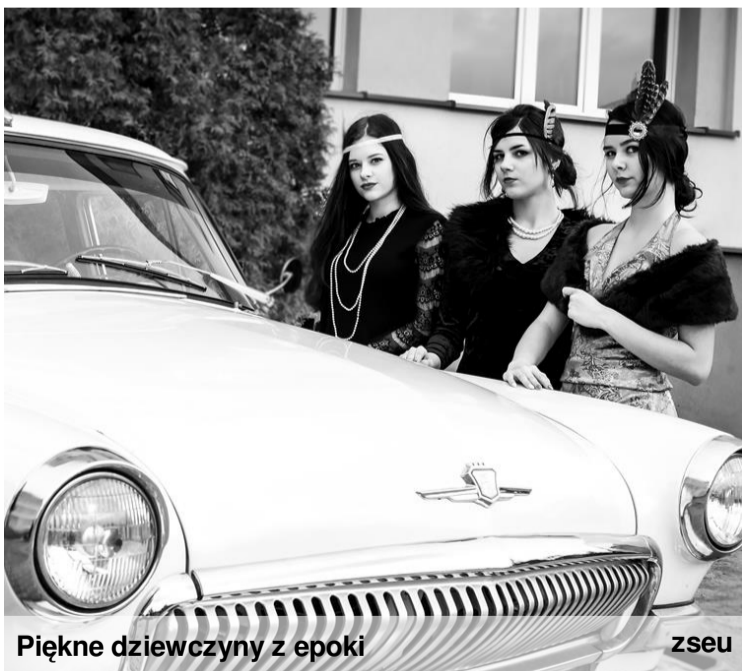
Piękne dziewczyny z epoki