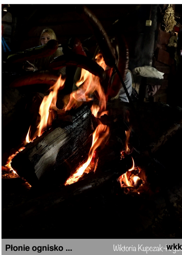
Płonie ognisko ...