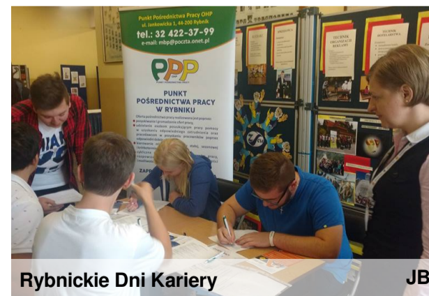
Rybnickie Dni Kariery