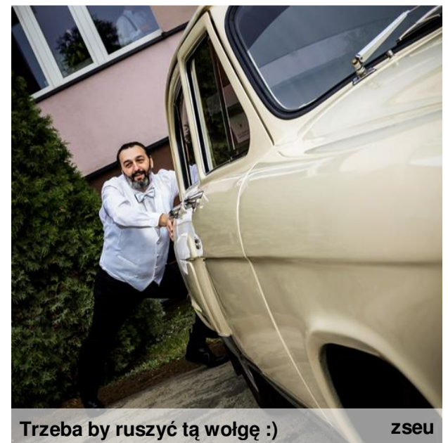
Trzeba by ruszyć tą wolgę :)