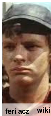
feri acz wiki

Dežo Gereb jest najbardziej skomplikowaną postacią w całej powieści. Zdradził drużynę Boki i przeszedł na stronę czerwonoskórych. W swoim życiu przeżył ogromny wstrząs i uświadomił sobie, że dotychczas postępował bardzo źle. Zmienił się, wziął za przykład swojego uczciwego ojca i stał się innym chłopcem zasługującym na szacunek kolegów.