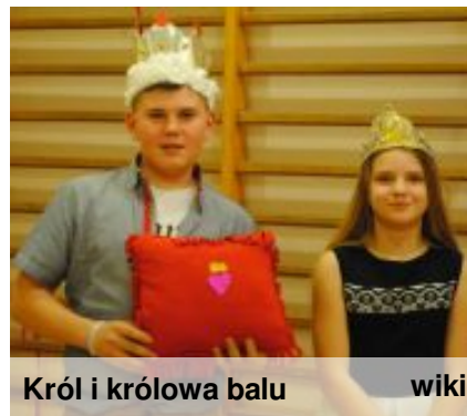
Król i królowa balu

Dnia 29 stycznia 2018 r. w naszej szkole odbyła się zabawa choinkowa. Dzieci bawiły się w trzech grupach: klasy 0 – I i młodsi, klasy II – IV i najstarsi, czyli klasy V – VII. Barwne stroje karnawałowe mogliśmy podziwiać w dwóch młodszych przedziałach. Nie brakowało księżniczek, policjantów, strażaków. Odwiedziła nas nawet smurfetka! W najstarszej grupie również nie brakowało atrakcji. Chłopcy mogli sprawdzić się w roli makijażystów, malując swoje koleżanki, ale to nie wszystko! Dziewczyny również malowały, ale nie koleżanki... tylko kolegów! Było dużo śmiechu i zabawy. Na koniec wybraliśmy króla i królową balu, posprzątaaliśmy salę. O to, by uczniowie nie byli głodni, zadbały mamy, przygotowując kanapki i pyszne ciasta. (wiki)