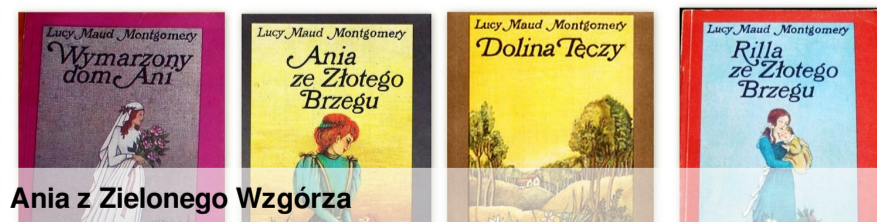
Ania z Zielonego Wzgórza