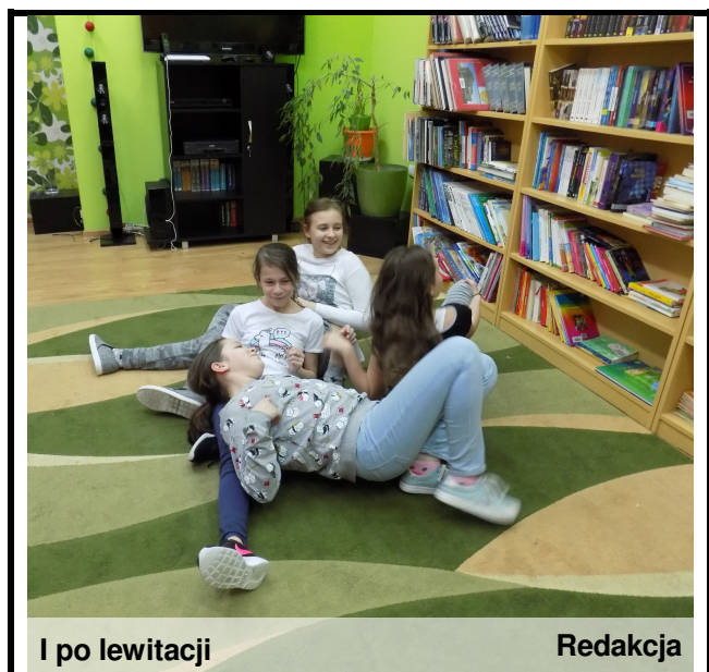
I po lewitacji