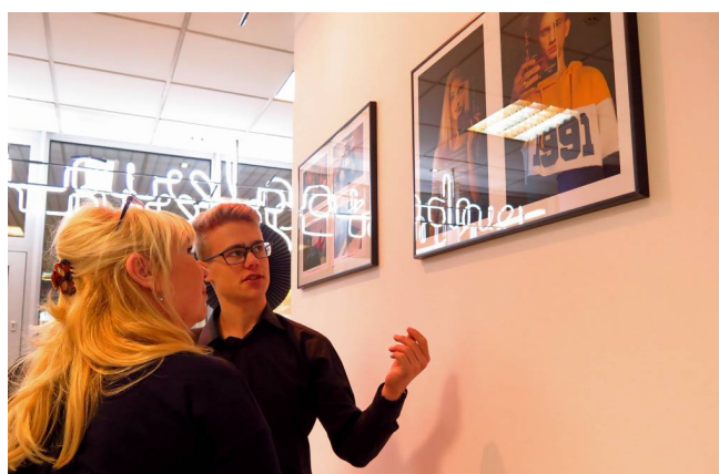
Rozmowy o fotografii