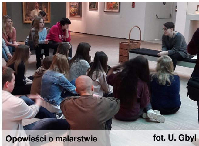
Opowieści o malarstwie

Nasi ekonomiści i technicy organizacji reklamy, jak co roku, podjęli ten trud. Na początek, oczywiście, egzamin teoretyczny (10, 11 stycznia), a potem część, która miała za zadanie sprawdzić umiejętności praktyczne (17, 18, 19 stycznia). Zaskoczyły przyrodnicze elementy tego egzaminu, a mianowicie zaprojektowanie w programie COREL liści kasztanowca, koniczyny lub kwiatu rumianku. Mamy nadzieję, że z tej bitwy wszyscy wyszli zwycięsko, a wyniki tylko to potwierdzą.