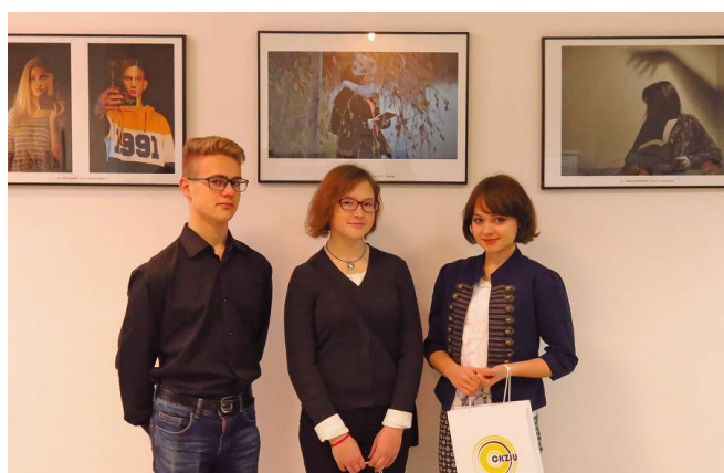
Laureaci i ich prace