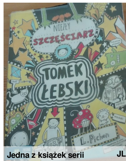
Jedna z książek serii

Obie serie można wypożyczyć w naszej bibliotece. Cieszą się one od lat bardzo dużą popularnością.