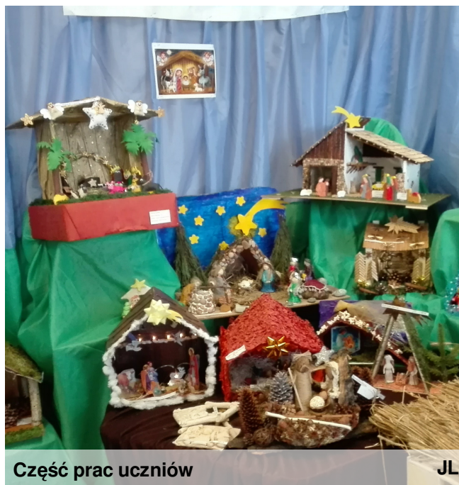
Część prac uczniów

18 stycznia w SP nr 38 w Gliwicach uczniowie naszej szkoły uczestniczyli w uroczystej gali wręczenia nagród w XV Miejskim Konkursie Szopek Rodzinnych. Założeniem konkursu jest wykonanie szopki przy współpracy z innymi członkami rodziny. I tym razem nasi uczniowie odnieśli tu wiele sukcesów – do naszej szkoły należało 1 i 3 miejsce oraz 3 wyróżnienia! Na laureatów czekał słodki poczęstunek oraz przedstawienie jasełkowe przygotowane przez uczniów klasy trzeciej gospodarza konkursu. Spotkanie przebiegło w bardzo miłej atmosferze.