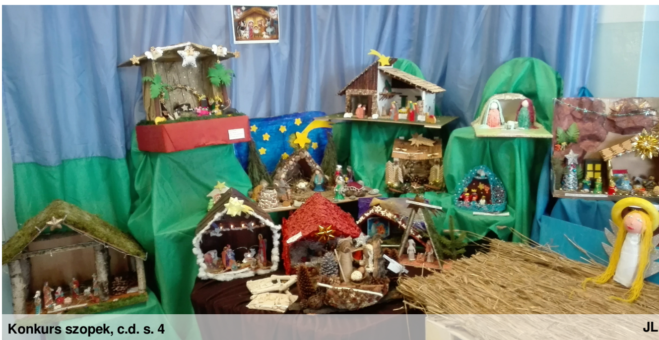
Konkurs szopek, c.d. s. 4