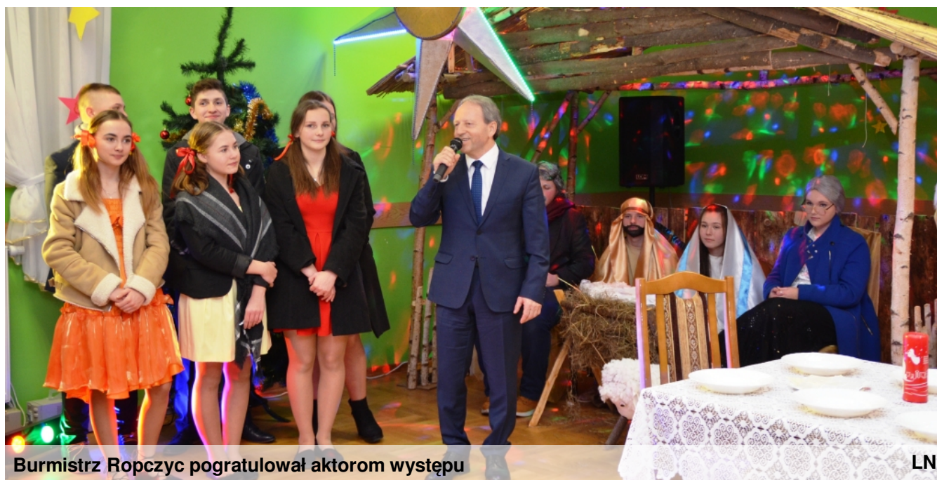
Burmistrz Ropczyc pogratulował aktorom występu