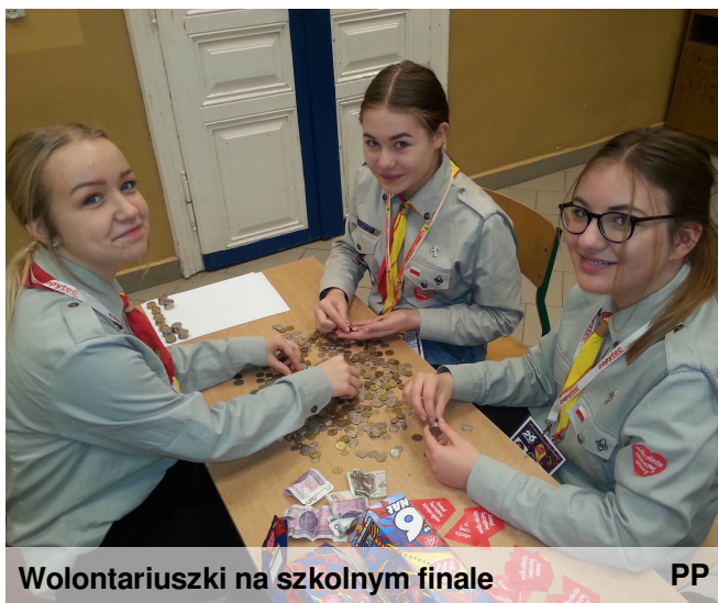
Wolontariuszki na szkolnym finale