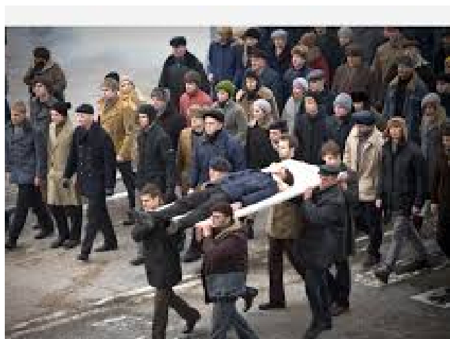
Kadr z filmu "Czarny czwartek"

„Nazywaj wolnymi nie tych, którzy są wolni za sprawą losu, lecz tych, którzy są wolni przez sposób życia i postępowania” - Antoni Wielki