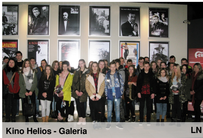
Kino Helios - Galeria