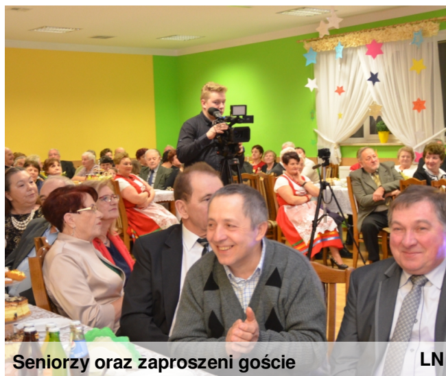
Seniorzy oraz zaproszeni goście