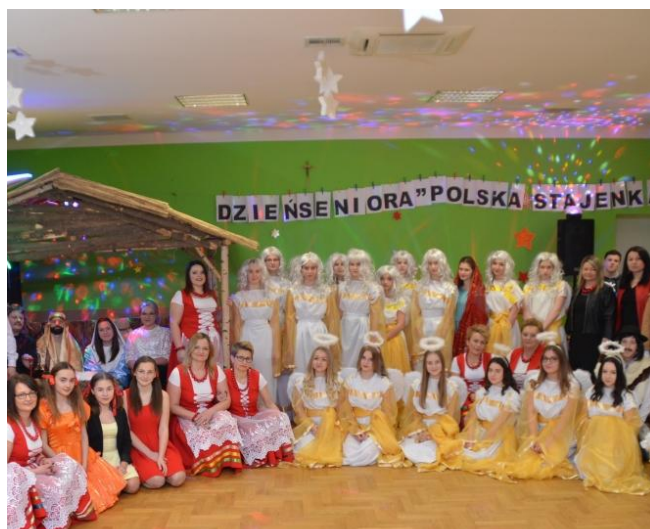
Pamiętkowe zdjęcie z KGW Łączki Kuch.

Członkowie Koła Teatralnego składają serdeczne podziękowania Kołu Gospodyń Wiejskich za zaproszenie, ciepłe przyjęcie oraz poczęstunek, przedstawicielom organizacji wiejskich za pyszne słodczyce. Dyrekcji szkoły oraz nauczycielom za opiekę i przygotowanie występu.