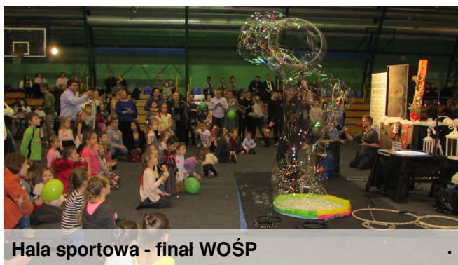
Hala sportowa - finał WOŚP