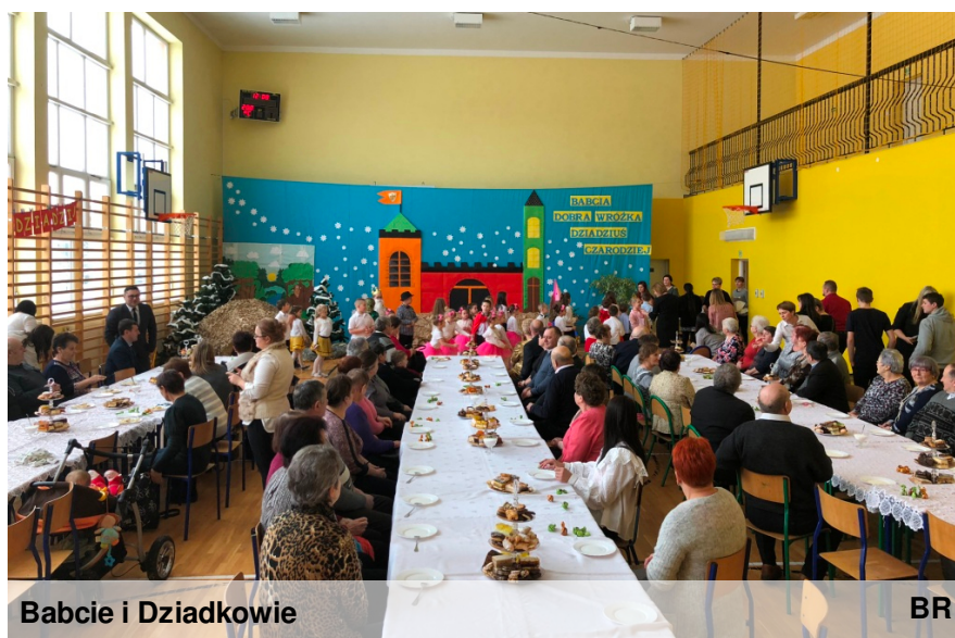
Babcie i Dziadkowie

Na zakończenie wszyscy odśpiewali słynne „Sto lat”... Występ bardzo wszystkich zachwycił. W podziękowaniu dzieci otrzymały gromkie brawa i owacje na stojąco.