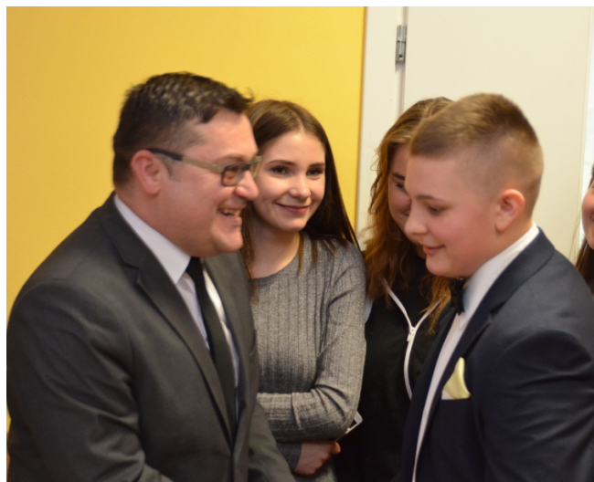
Życzenia dla dyrektora szkoły