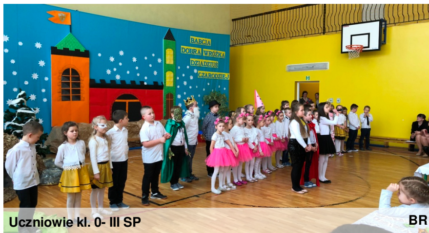
Uczniowie kl. 0- III SP