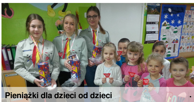
Pieniążki dla dzieci od dzieci