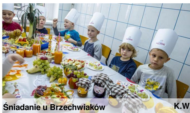
Śniadanie u Brzechwiaków