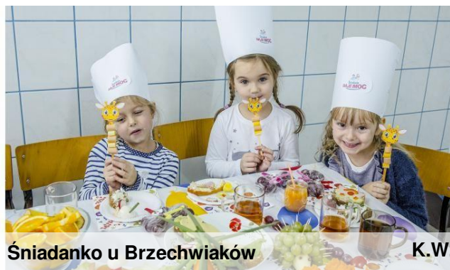
Śniadanko u Brzechwiaków