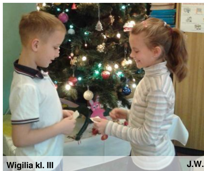
Wigilia kl. III