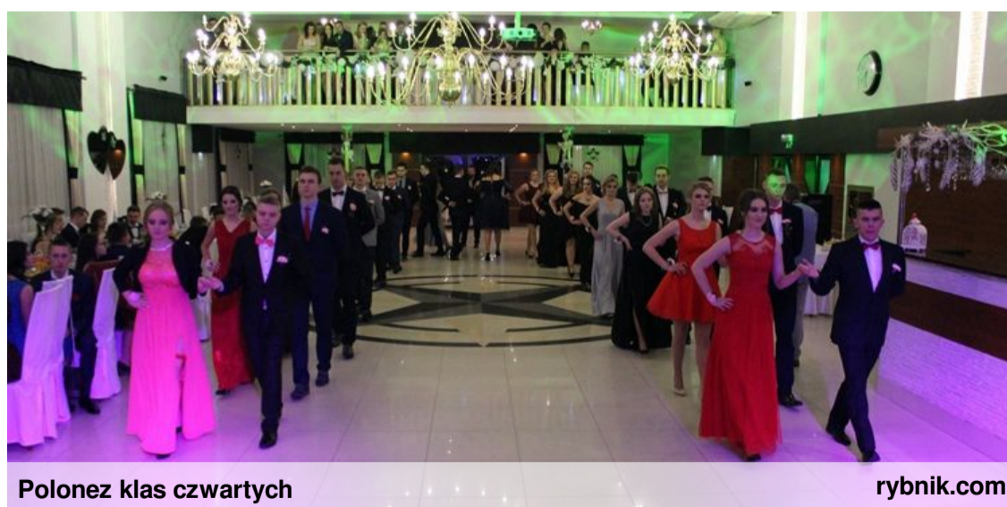
Polonez klas czwartych