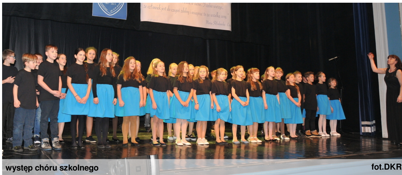
występ chóru szkolnego