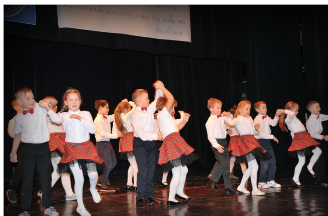
klasa 2 b