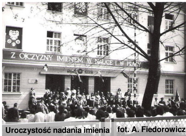
Uroczystość nadania imienia

1 września 2000 r. rozpoczęła działalność świetlica środowiskowa przy SP 10, finansowana przez MKPiRPA w Jeleniej Górze. W okresie wakacji 2001 r. zakończono prace adaptacyjne w bibliotece i czytelnicy szkolnej. Powierzchnia użytkowa pomieszczeń bibliotecznych została dostosowana do potrzeb środowiska szkolnego. 10 kwietnia 2002 r. odbył się pierwszy sprawdzian zewnętrzny uczniów klas 6. Wyniki : średnia województwa- 29,9 p. średnia miasta- 30,4 p. średnia SP 10- 31,8 p.