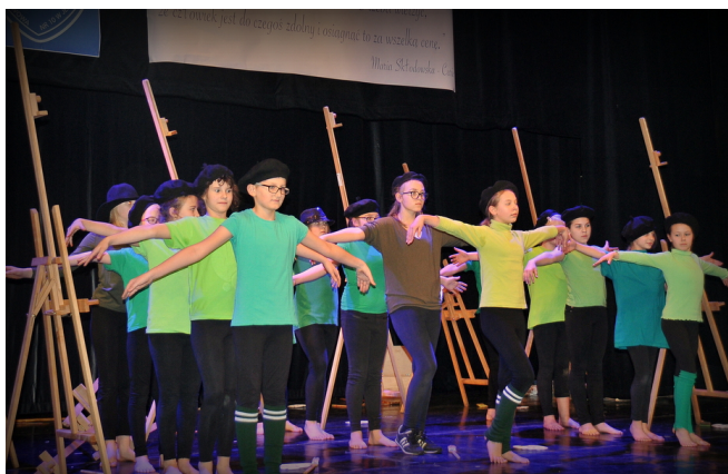
Grupa teatralna "Epidemia"

Trzeba mieć wytrwałość i wiarę w siebie. Trzeba wierzyć, że człowiek jest do czegoś zdolny i osiągnąć to za wszelką cenę (Maria Skłodowska-Curie)