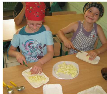
Dobre nawyki żywieniowe kształtuje się od najmłodszych lat.

wzbogacają posiadaną już wiedzę oraz wspólnie sporządzają, a potem spożywają owocowe sałatki, warzywne surówki, kanapki z warzywami, koktajle czy owocowe