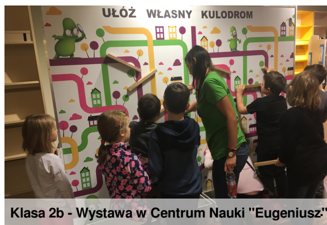
Klasa 2b - Wystawa w Centrum Nauki "Eugeniusz"