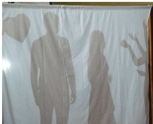
Jasełka - teatr cieni.