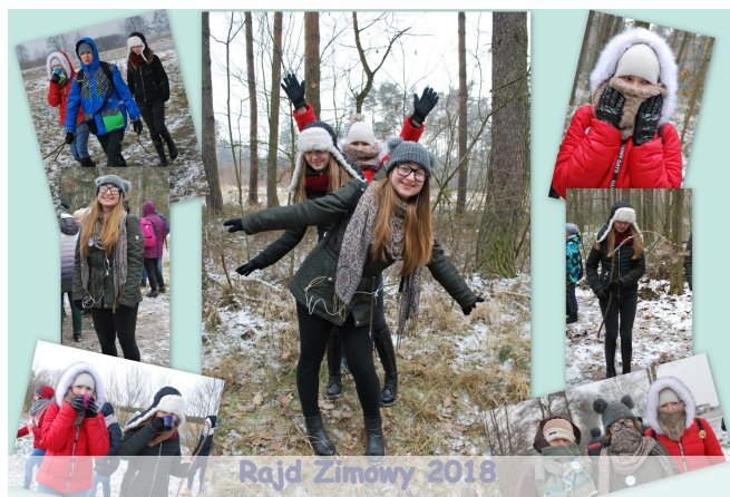
Rajd Zimowy 2018