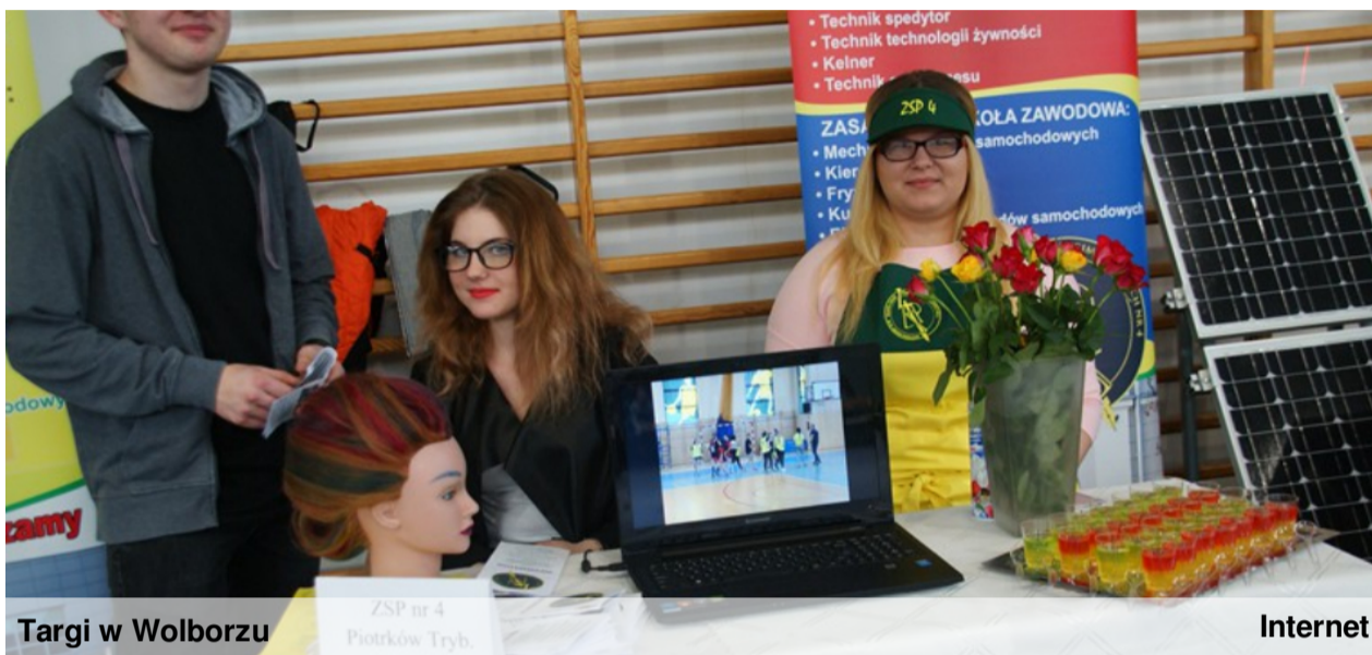
Targi w Wolborzu