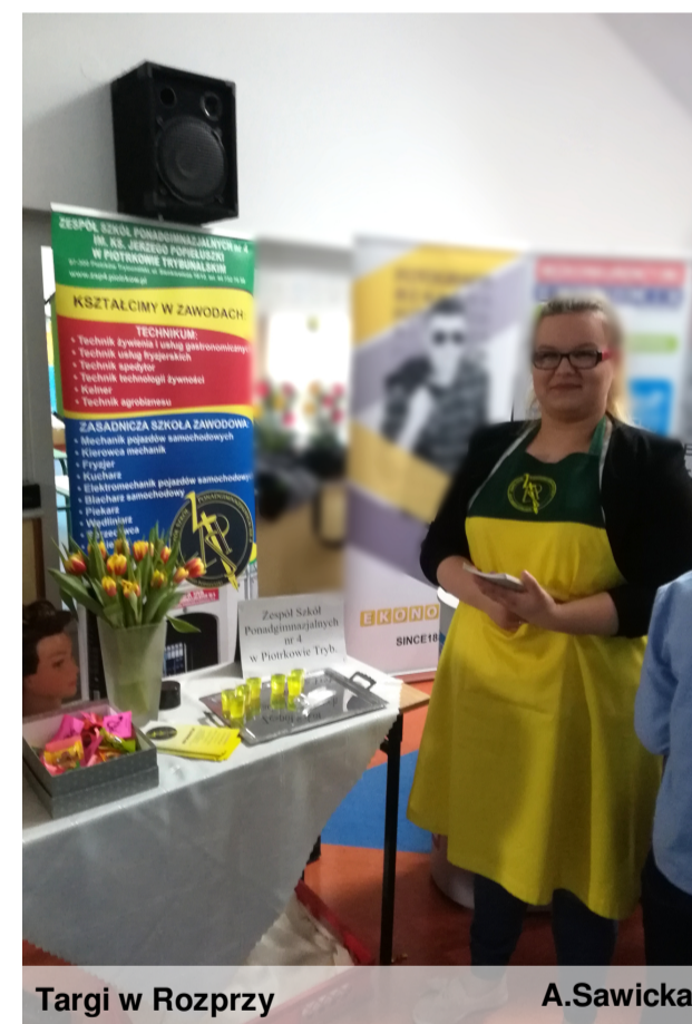
Targi w Rozprzy