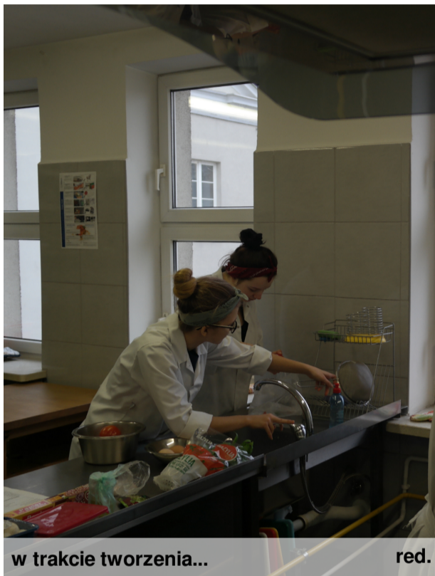
w trakcie tworzenia...