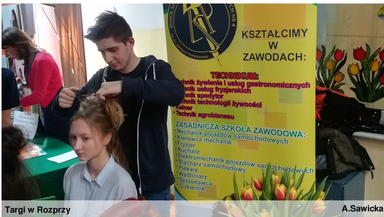
Targi w Rozprzy

W Targach Edukacyjnych w Wolborzu wzięło udział ponad 180 gimnazjalistów.