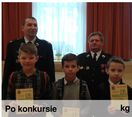
Po konkursie kg

W dniu 6 marca w GOK-u w Gromniku odbyły się eliminacje gminne do Ogólnopolskiego Turnieju Wiedzy Pożarniczej. Wzięło w nim udział około 40 uczniów, w tym trójka z naszej szkoły. Niestety, nikt z Brzozowej nie dostał się do dalszego etapu. Możemy im jednak gratulować, gdyż brakowało im po 1 lub 3 punkty do finału. (stagot)