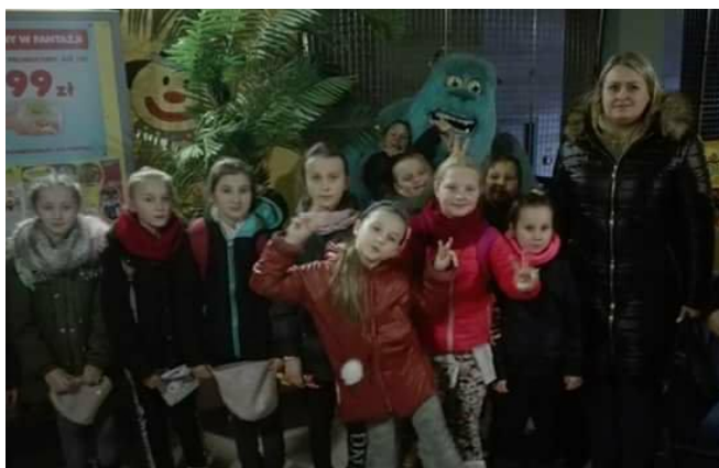
Klasa III z wychowawczynią