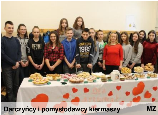
Darczyńcy i pomysłodawcy kiermaszy MZ