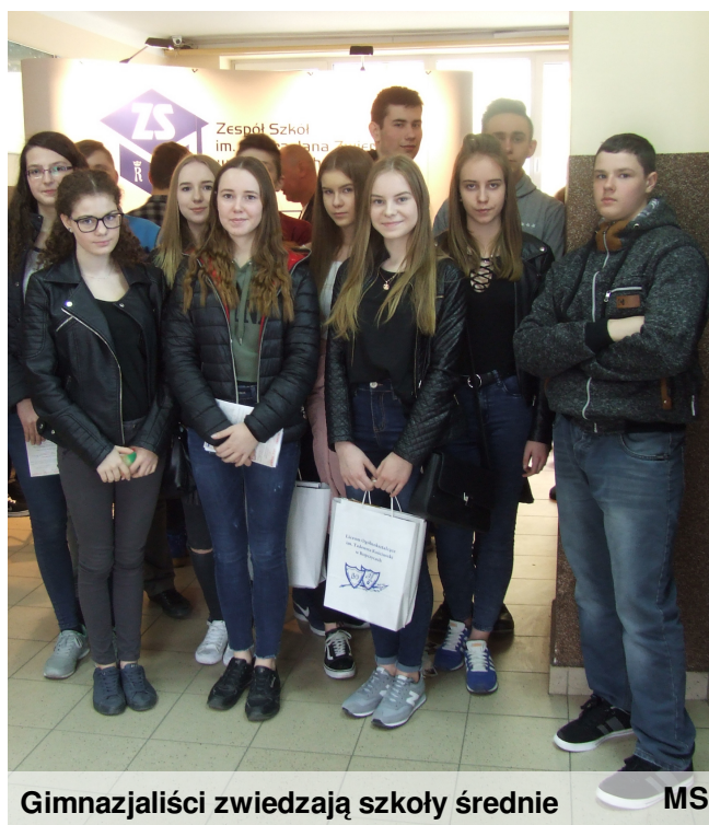
Gimnazjaliści zwiedzają szkoły średnie