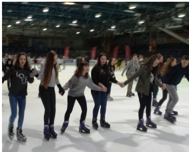
Taniec na lodzie