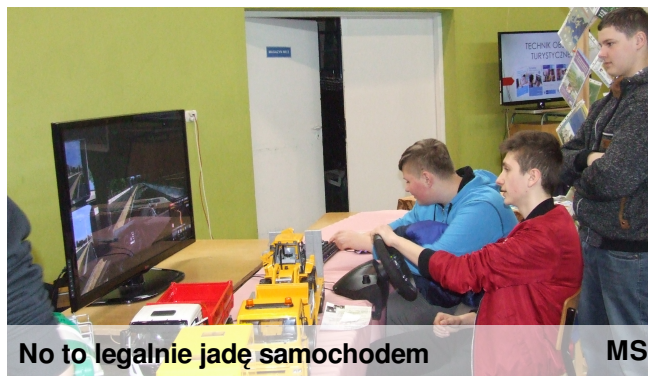
No to legalnie jadę samochodem

GWÓZDŹ NUMERU - S. 2 OKIEM SZKOLNEGO REPORTERA - s.3-8 KLUB SZKOLNEGO LITERATA - s. 9-11 PLOTKI - s. 12