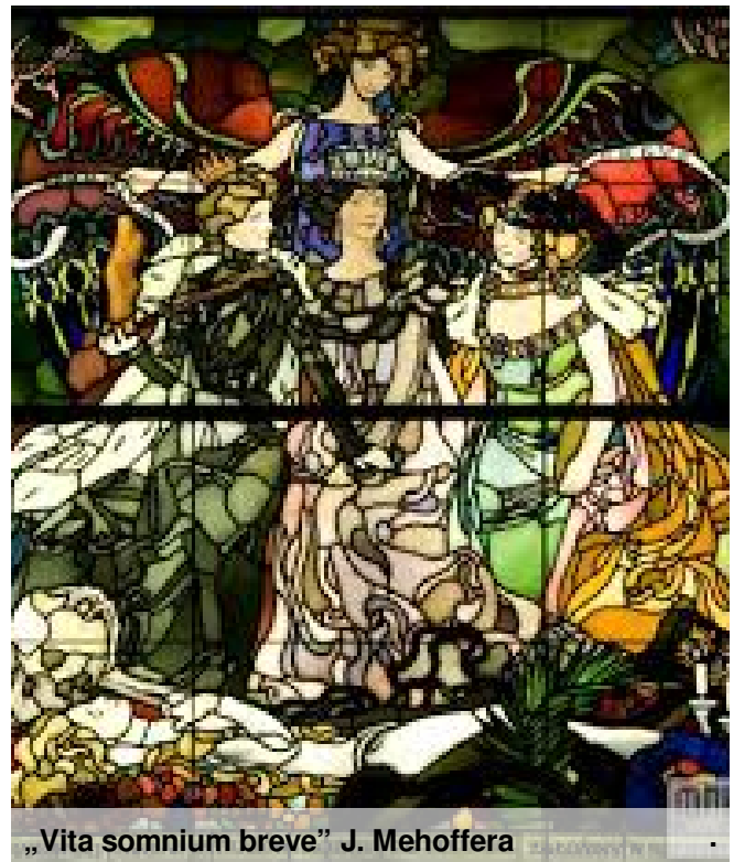
„Vita somnium breve” J. Mehoffera

Najbardziej zaintrygowała mnie jednak dolna część witrażu - martwa kobieta, oznaczająca śmierć. Fakt, że nie trwamy wiecznie, już często wywoływał u mnie wiele refleksji. Jest to bowiem jeden z większych strachów człowieka. Każdego z nas ostrzegano