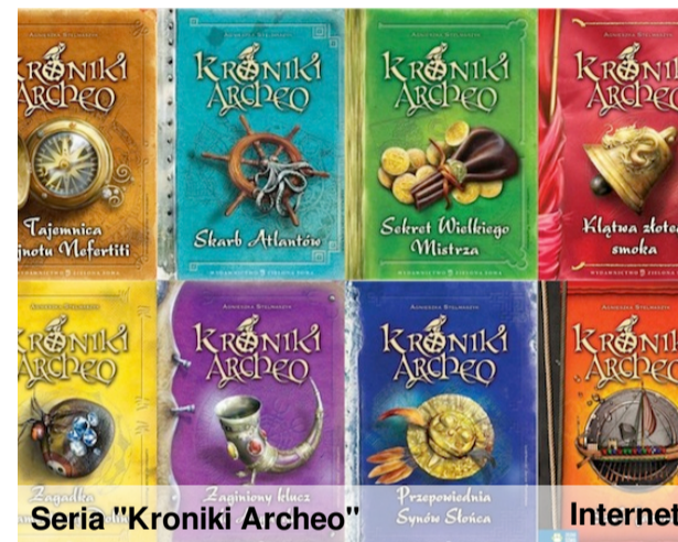
Seria "Kroniki Archeo"