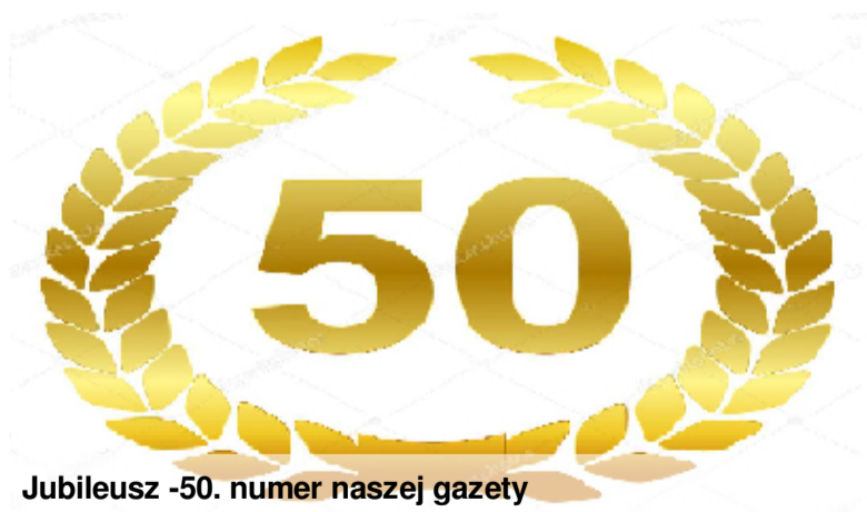
Jubileusz -50. numer naszej gazety