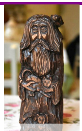
Rzeźba Cz. Żemły