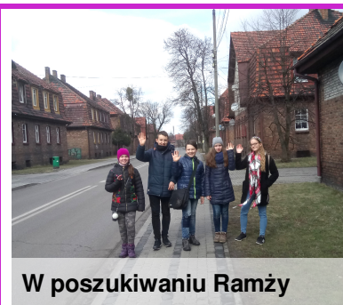
W poszukiwaniu Ramży

Jak wyglądał rozbójnik Ramża? Na to pytanie trudno odpowiedzieć, ale można go sobie wyobrazić, słuchając opowiadanych o nim historii i legend. My prezentujemy kilka różnych wizerunków tego tajemniczego rozbójnika – tych znalezionych w Internecie i tych, które zostały narysowane przez uczniów naszej szkoły! Zobaczcie zdjęcia i przeczytajcie legendę o sprytnym rozbójniku, który niegdyś mieszkał w jaskini na górze Ramży.