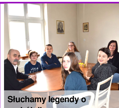
Słuchamy legendy o rozbójniku