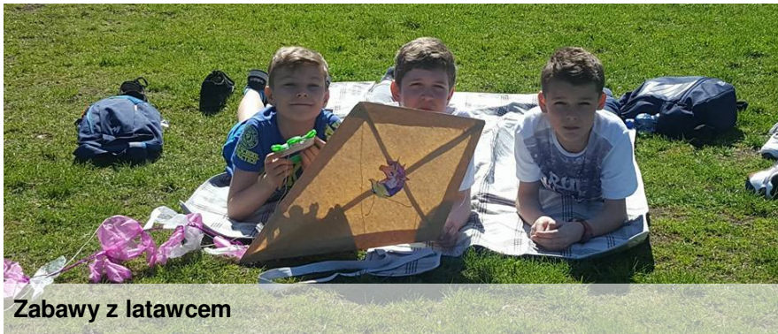
Zabawy z latawcem