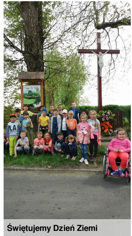
Świętujemy Dzień Ziemi