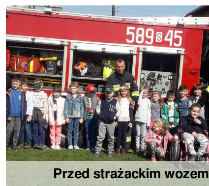
Przed strażackim wozem