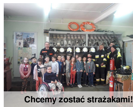
Chcemy zostać strażakami!