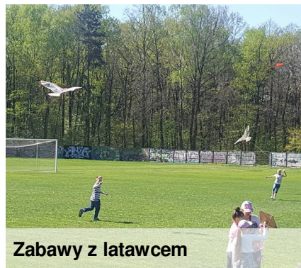
Zabawy z latawcem