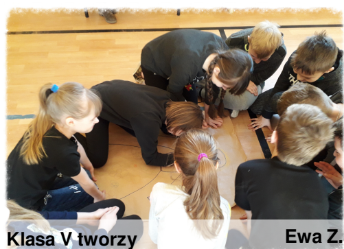
Klasa V tworzy