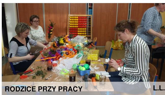
RODZICE PRZY PRACY