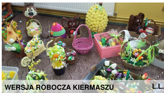
WERSJA ROBOCZA KIERMASZU