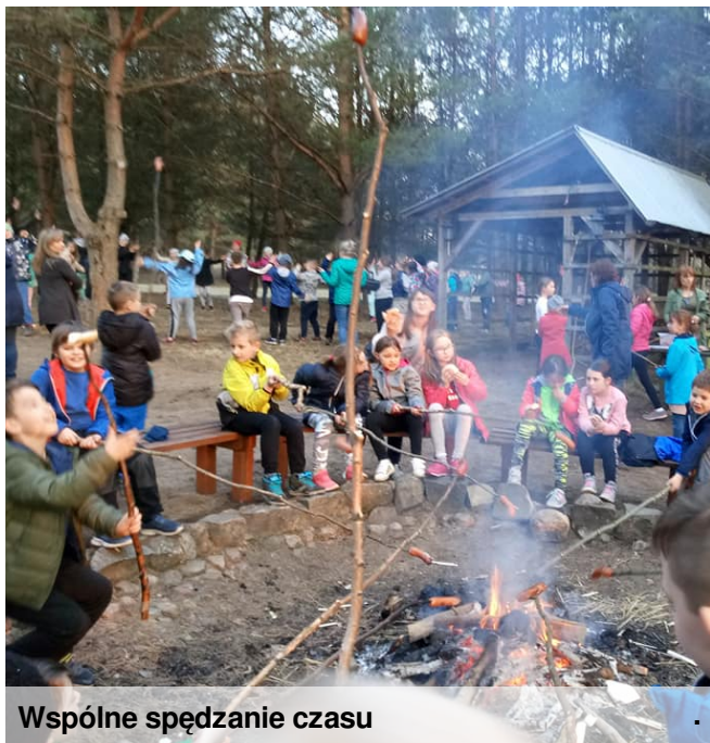
Wspólne spędzanie czasu