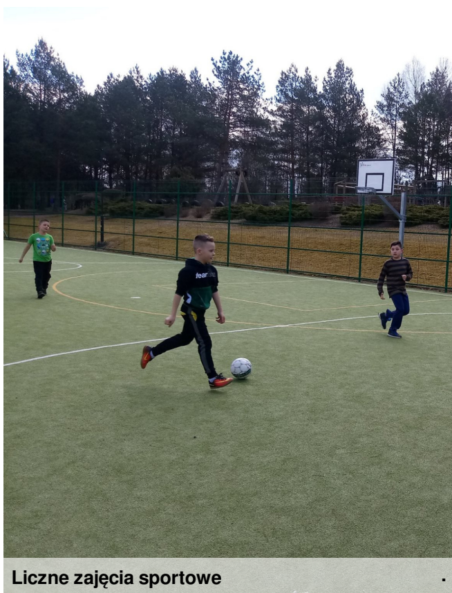
Liczne zajęcia sportowe