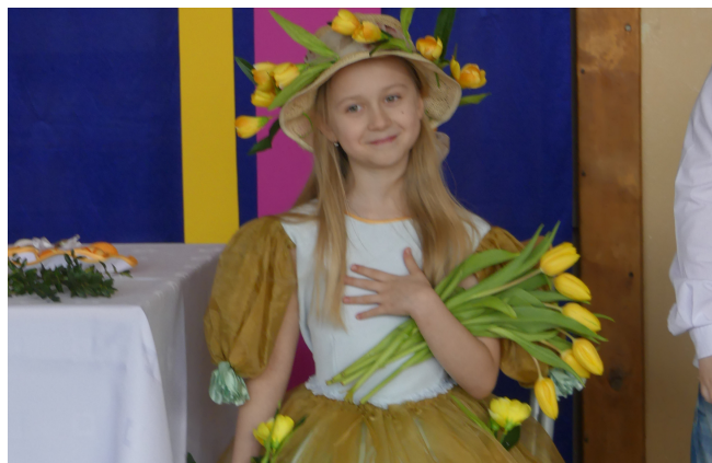
Piękna Pani Wiosna