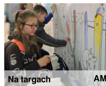
Na targach AM