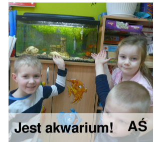
Jest akwarium!