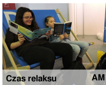
Czas relaksu AM