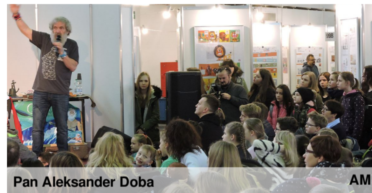
Pan Aleksander Doba AM

też inne, m.in. wystawa z cyklu „Salon Ilustratorów” oraz prac wykonanych przez uczniów Ośrodka Szkolno-Wychowawczego w Owińskach dla Dzieci Niewidomych do wierszy J. Brzechwy.