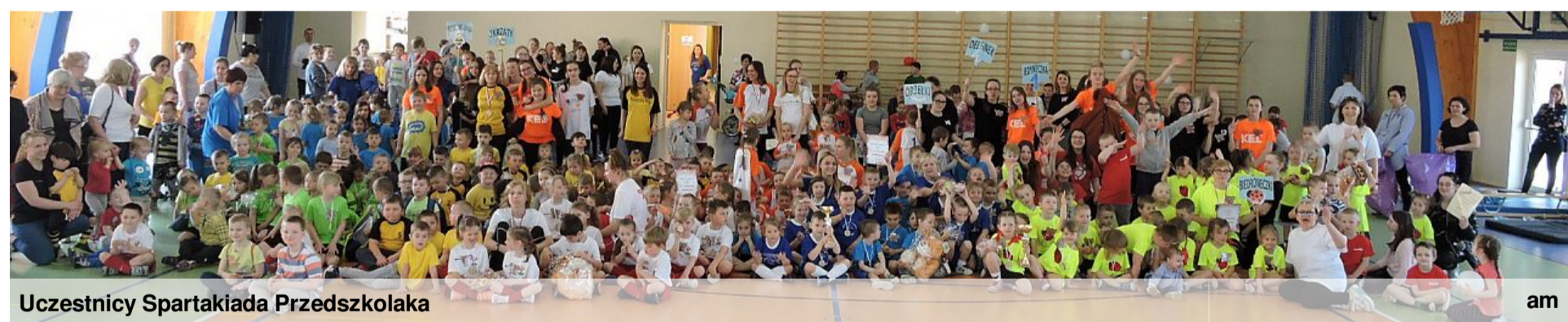
Uczestnicy Spartakiada Przedszkolaka