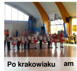
Po krakowiaku am