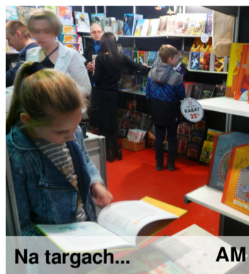
Na targach... AM

Obejrzeliby też kilka wystaw. Składały się one przede wszystkim z prac pochodzących z książek dla dzieci. Na jednej z takich prezentacji, zatytułowanej „Mistrzowie ilustracji”, znalazły się obrazy wspomnianej K. Michałowskiej. Ale były