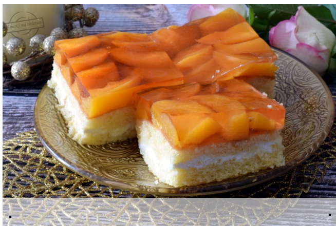
Szybki biszkopt z owocami