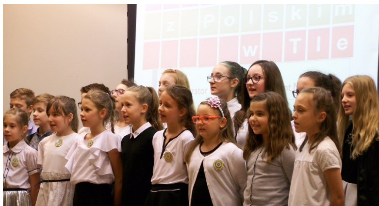
Podczas gali wystąpił m.in. zespół "Wiolinki"