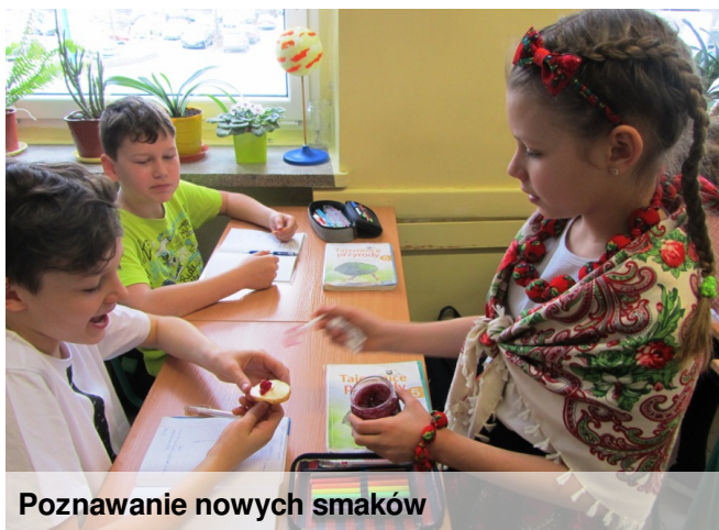
Poznanwanie nowych smaków