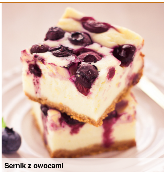
Sernik z owocami