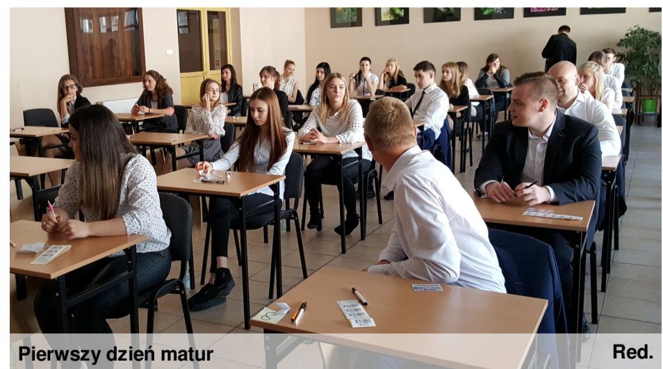
Pierwszy dzień matur