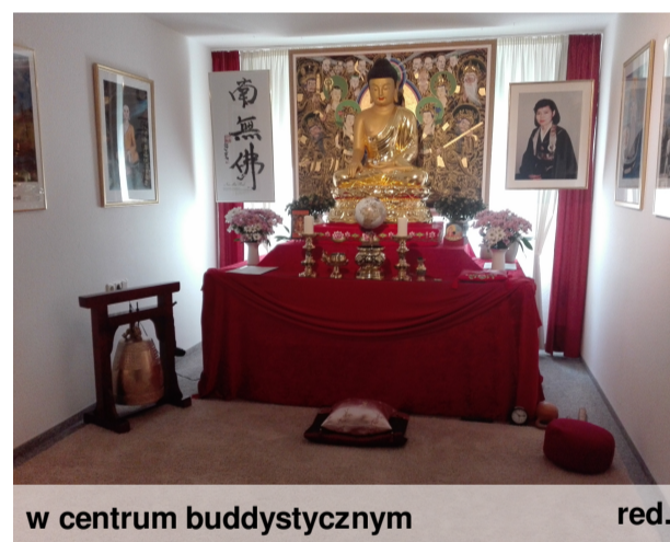
w centrum buddystycznym