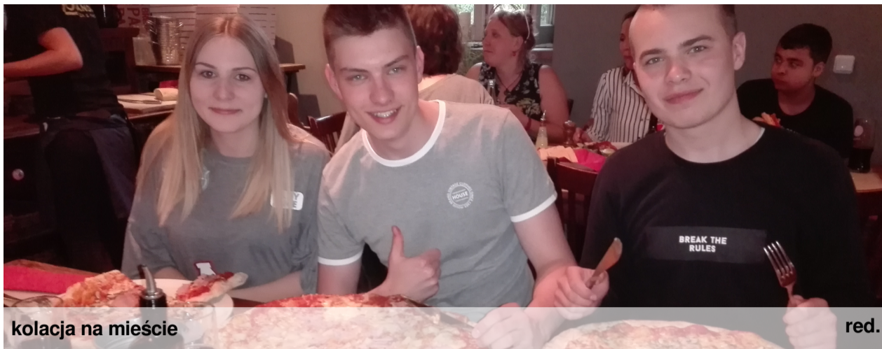
kolacja na mieście