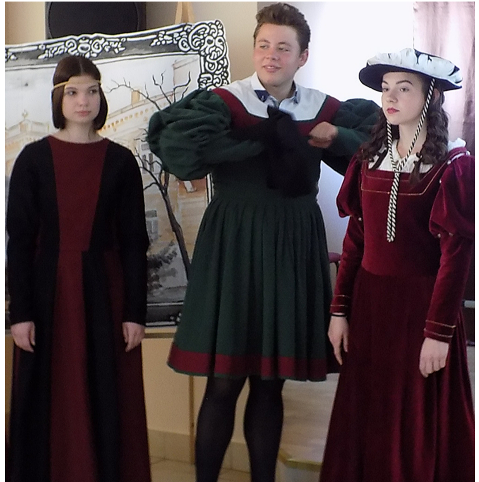
w czasie pokazu