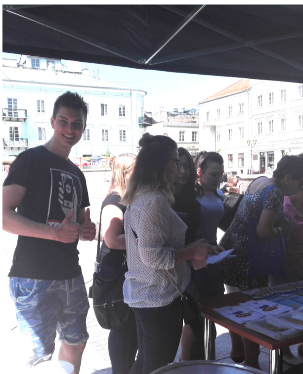
zabawa była przednia