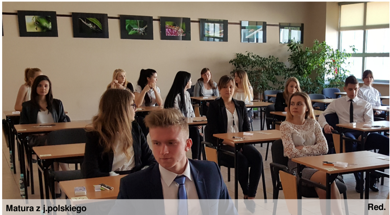
Matura z j.polskiego