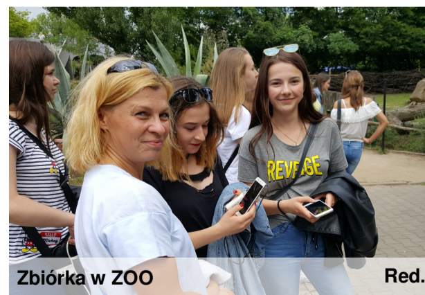
Zbiórka w ZOO