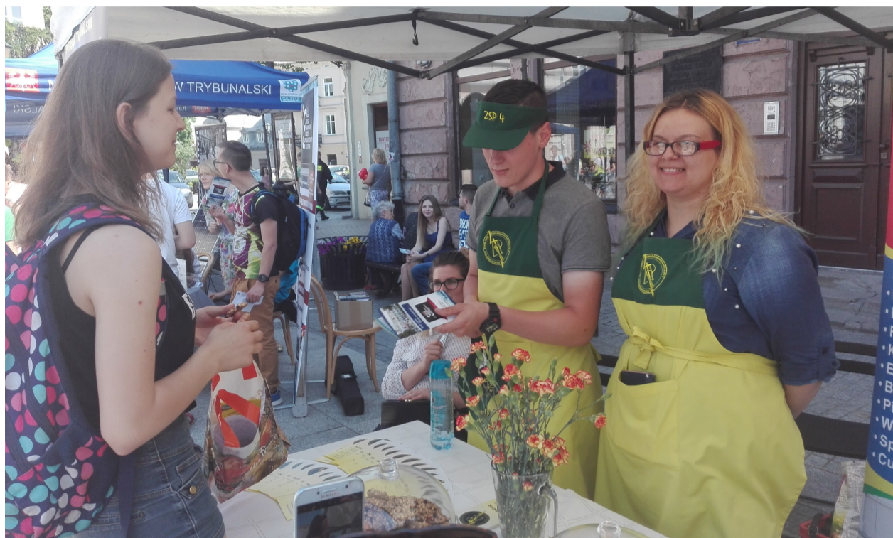
stoisko ZSP 4