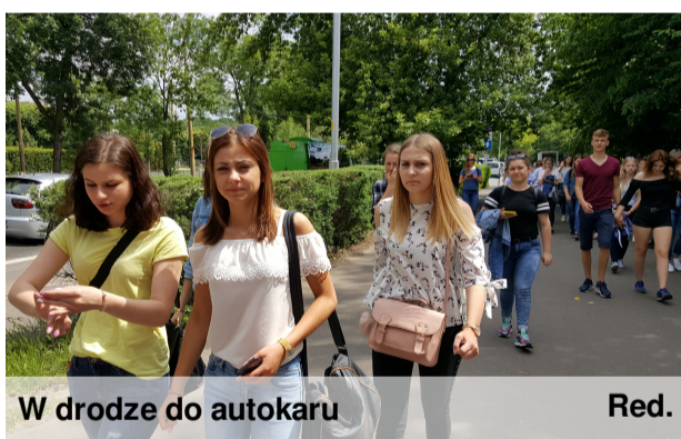
W drodze do autokaru