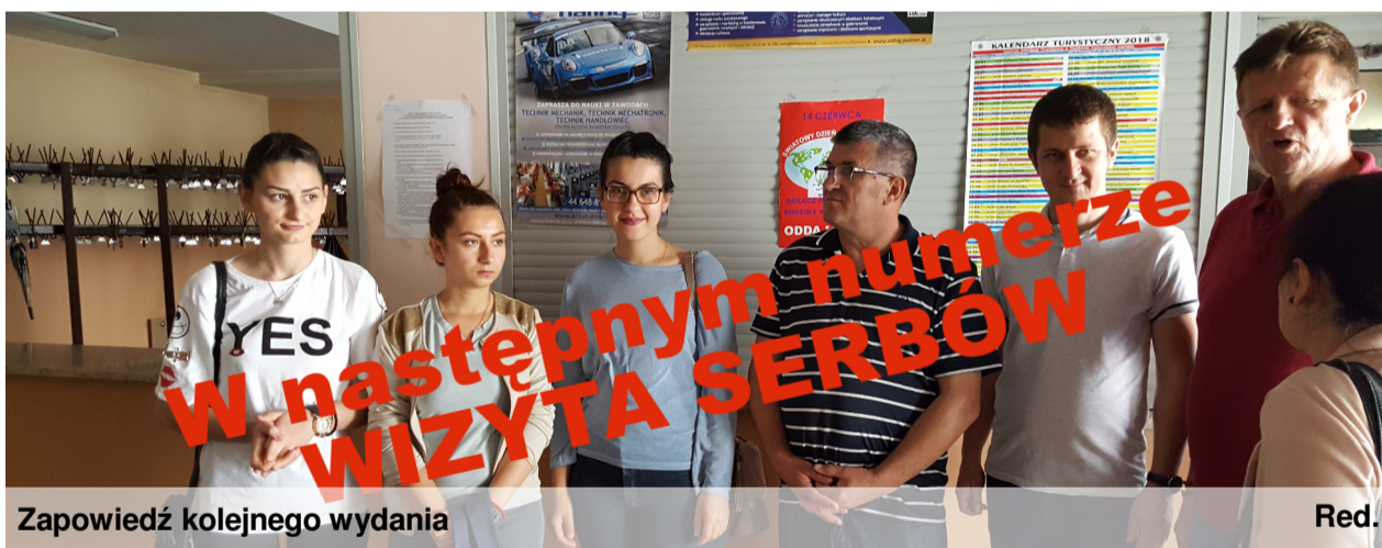
Zapowiedź kolejnego wydania