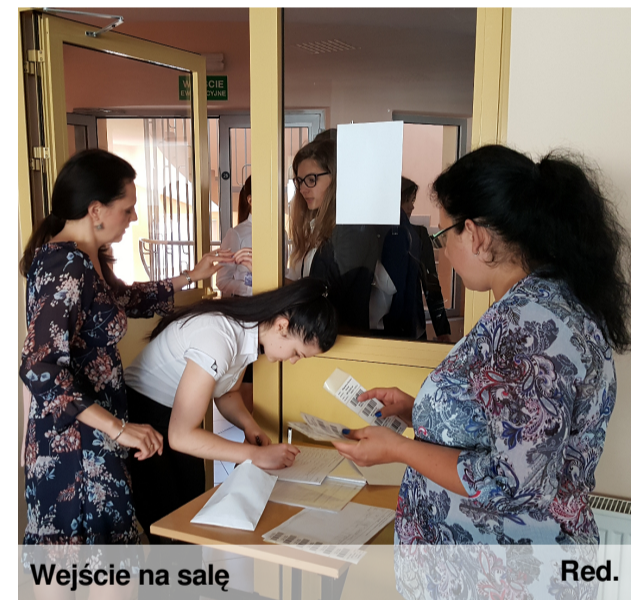
Wejście na salę

Zgodnie z obecnymi zasadami, maturzysta musi przystąpić do trzech obowiązkowych pisemnych egzaminów z: języka polskiego, języka obcego i matematyki na poziomie podstawowym. Musi również przystąpić do co najmniej jednego pisemnego egzaminu na poziomie rozszerzonym z wybranego przez siebie przedmiotu. Oprócz egzaminów pisemnych do zaliczenia są także dwa ustne: z języka polskiego i języka obcego. Aby zdać maturę, trzeba uzyskać minimum 30 proc. punktów z wszystkich egzaminów obowiązkowych. Wynik egzaminu z przedmiotu do wyboru nie wpływa na uzyskanie świadectwa maturalnego (nie ma progu zaliczeniowego), służy tylko przy rekrutacji na studia.