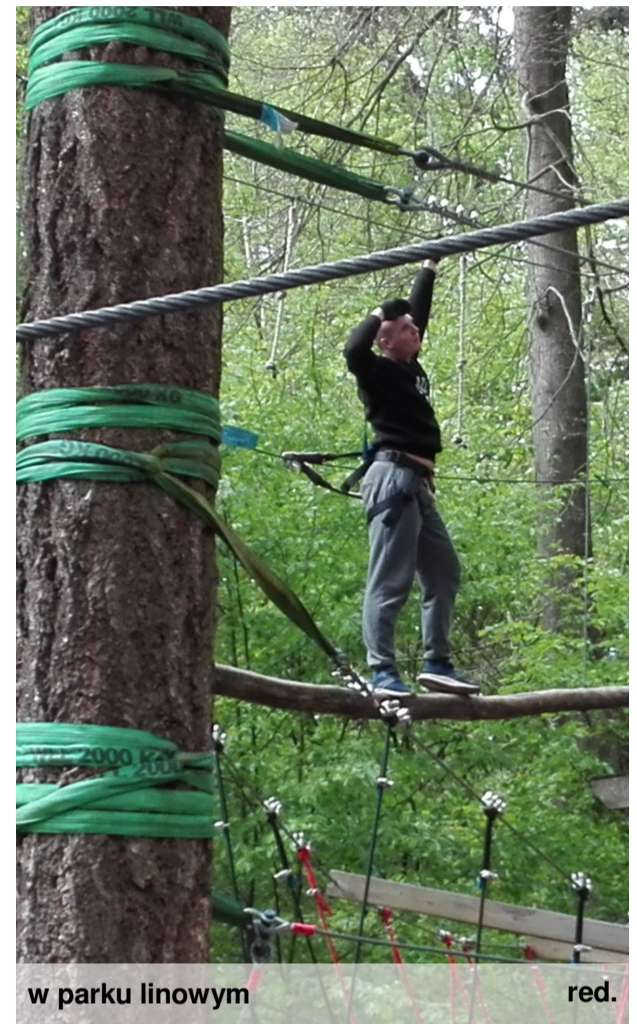
w parku linowym