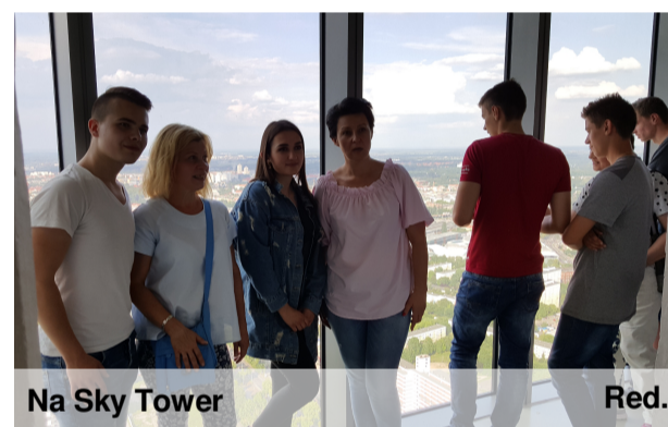
Na Sky Tower