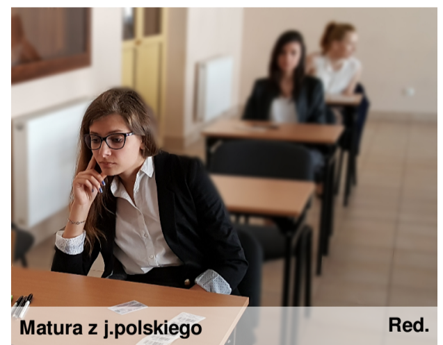
Matura z j.polskiego

Maturzyści muszą zmierzyć się także z egzaminami ustnymi. W tym roku już 8 maja pierwsza grupa zdawać będzie język niemiecki, 9 maja - język polski i 15 maja - język angielski. Egzamin z języka ojczystego będzie sprawdzał umiejętność tworzenia wypowiedzi na określony temat, inspirowanej tekstem kultury. Egzamin maturalny z języka obcego nowożytnego - ogólną kompetencję komunikacyjną absolwentów na poziomie średnio zaawansowanym lub zaawansowanym. Próg zaliczeniowy w obu przypadkach wynosi 30 %.