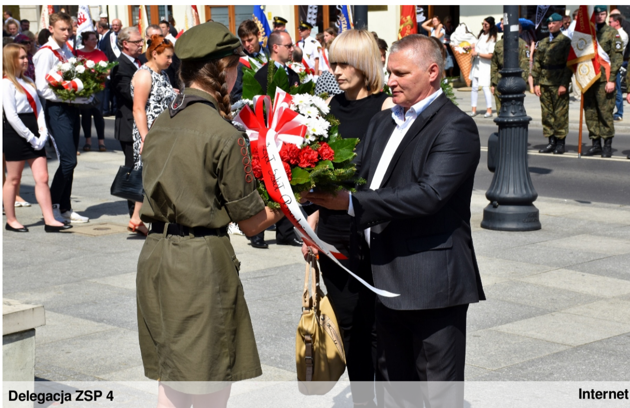
Delegacja ZSP 4