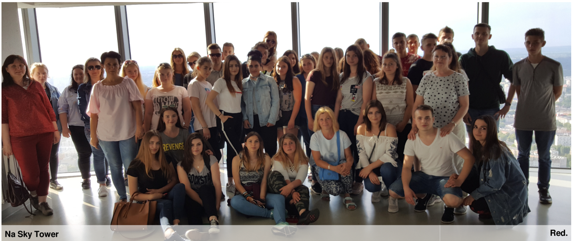
Na Sky Tower