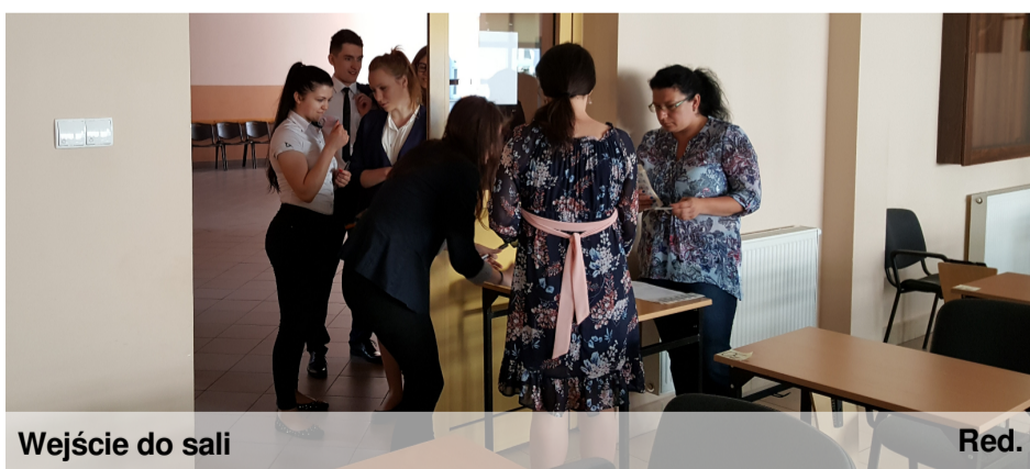
Wejście do sali