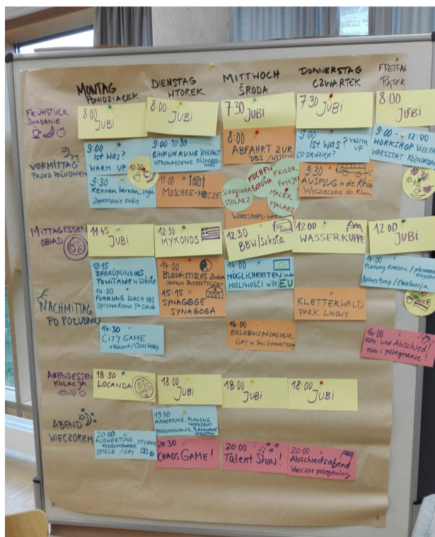
tygodniowy plan działania