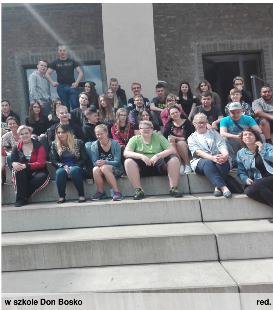
w szkole Don Bosko