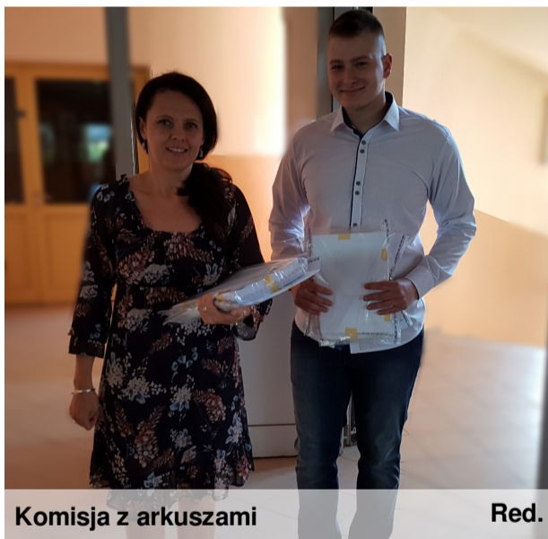
Komisja z arkuszami