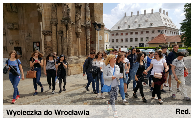
Wycieczka do Wrocławia