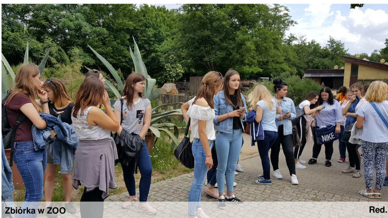
Zbiórka w ZOO