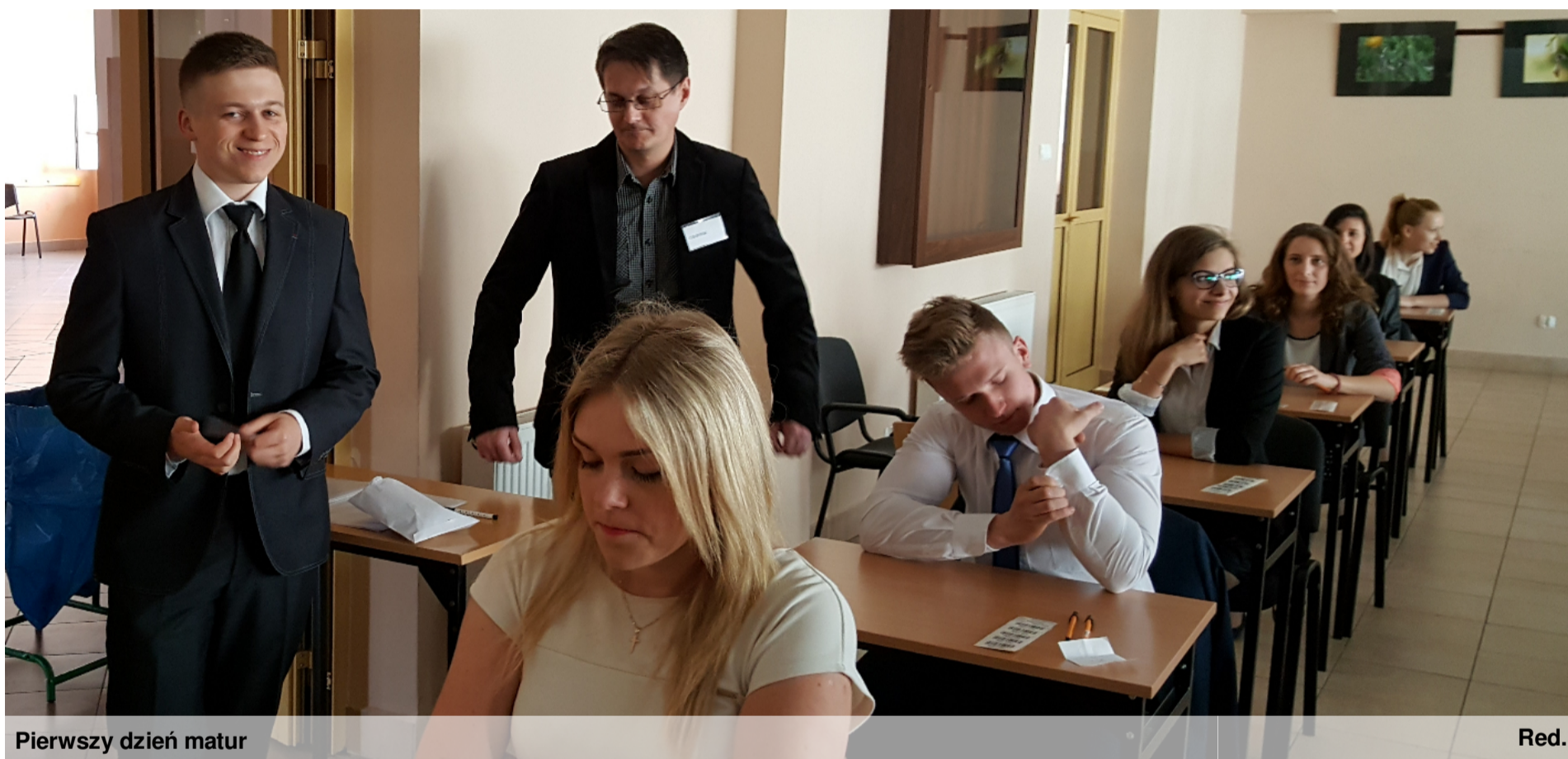
Pierwszy dzień matur