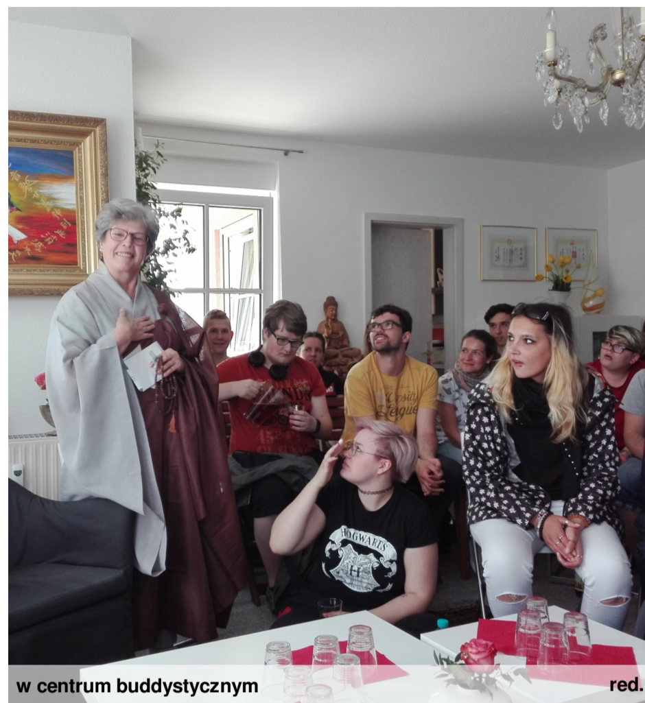
w centrum buddystycznym

Ten dzień to była prawdziwa lekcja historii, tolerancji, poszanowania odmienności religijnej.