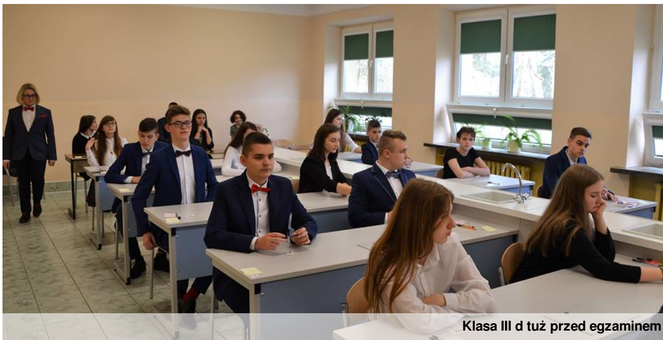
Klasa III d tuż przed egzaminem