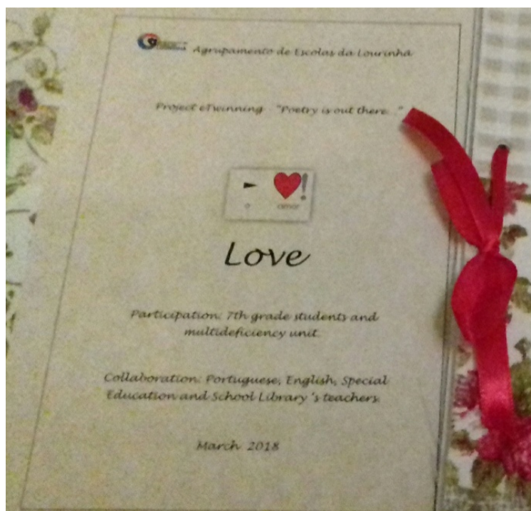
Wiersze z Portugalii