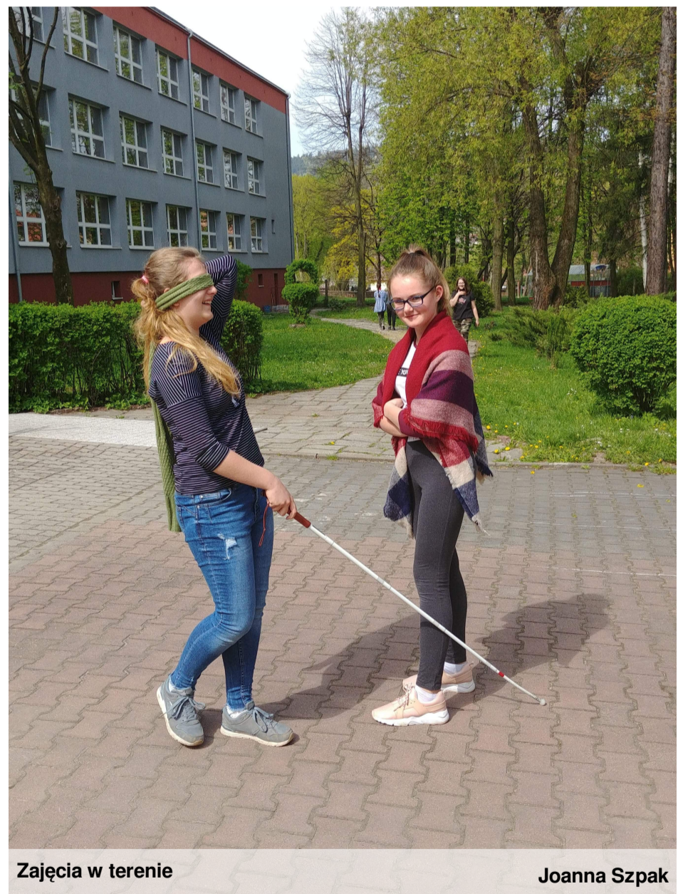
Zajęcia w terenie